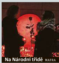
Na Národní třídě MAPRA

Vysokoškoláci uctí 17. listopad 1939 i 1989 na tradičním místě.