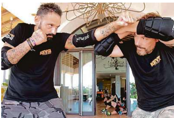
Při tréninku se klade důraz na orientaci v prostoru. KEYSI.CZ

Keysi vytvořil Španěl Justo Dieguez, sám držitel mistrovských pásů v několika bojových uměních. Jenže při potyčkách v realitě španělských diskoték zjistil, že tato umě-