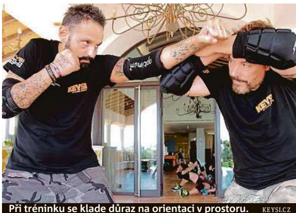
Při tréninku se klade důraz na orientaci v prostoru. KEYSI.CZ

Keysi vytvořil Španěl Justo Dieguez, sám držitel mistrovských pásů v několika bojových uměních. Jenže při potyčkách v realitě španělských diskoték zjistil, že tato umě-