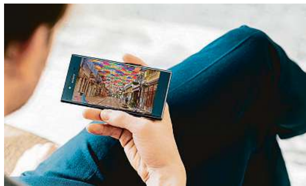
Telefon Sony Xperia XZ Premium

Telefon Sony o 7000 korun levněji. Další vlna slev v internetovém obchodě Mironet je tady.