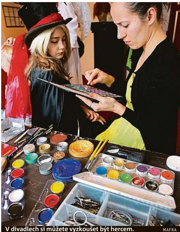
V divadlech si můžete vyzkoušet být hercem.

Pražské divadlo DISK se rozhodlo na jeden večer vytvořit malé soukromé Československo. U vstupu bude pro návštěvníky přichystán startovací balíček pro občana nového Československa. Ti se pak mohou těšit například na hodiny slovenského jazyka, dabingový workshop, přednášku o slovenském divadle či koncert, na kterém uslyší nejznámější československé hity. Divadlo NoD chystá autorskou inscenaci Se lvem na prsou, která reflektuje 100 let česko-slovenské hokejové republiky. Městské divadlo Kladno připravuje interaktivní „oživlé“ muzeum českoslo-