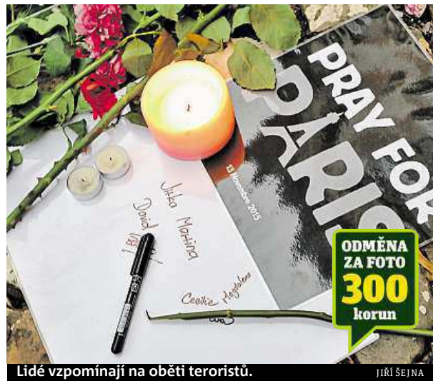
Lidé vzpomínají na oběti teroristů.