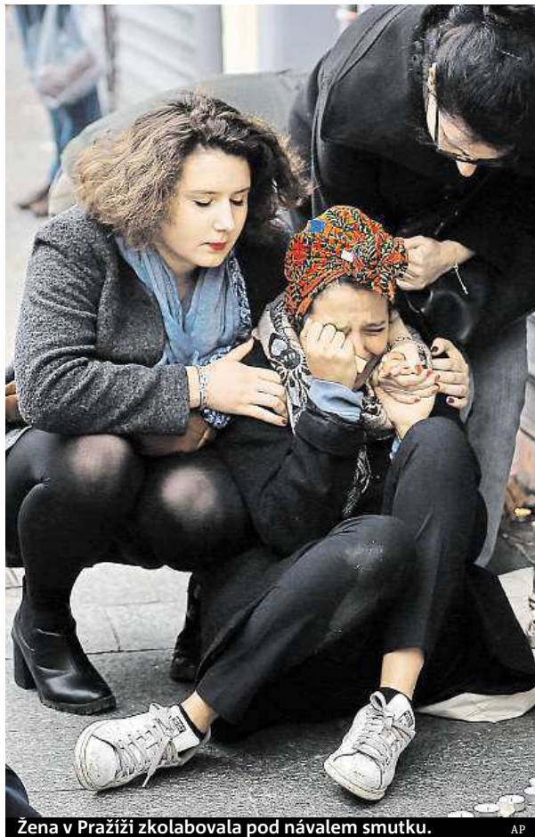
Žena v Paříži zkolabovala pod návalem smutku.

Černobílá kresba, která spojuje pacifistický symbol se stylizovaným zobrazením Eiffelovy věže, se stala symbolem útoků.