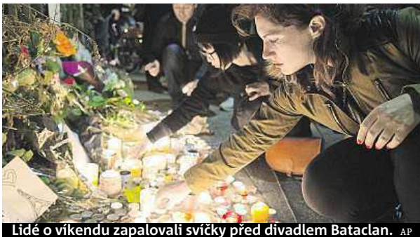
Lidé o víkendu zapalovali svíčky před divadlem Bataclan.

Ano, o chvíli později, co jsem si zapnul Facebook, jsem si uvědomil, že jedna kamarádka žije jen kousek od místa jednoho z útoků. Na-