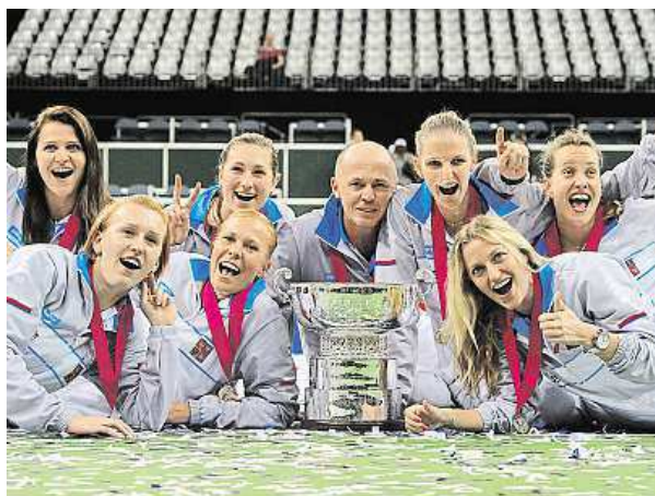
Hráčky, které se v sezoně zapojily do Fed Cupu.

„Jsem hrozně šťastný, jak to holky zvládly. Pěta odehrála nádherně utkáni s Marií. Kája to zvládla úplně fantasticky.