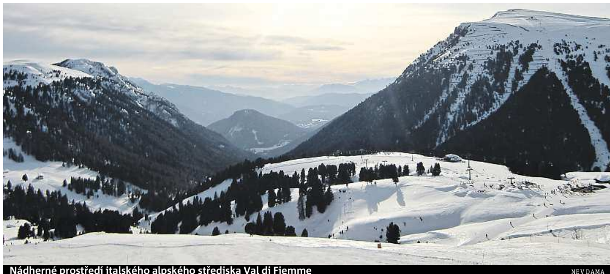
Nádherné prostředí italského alpského střediska Val di Fiemme