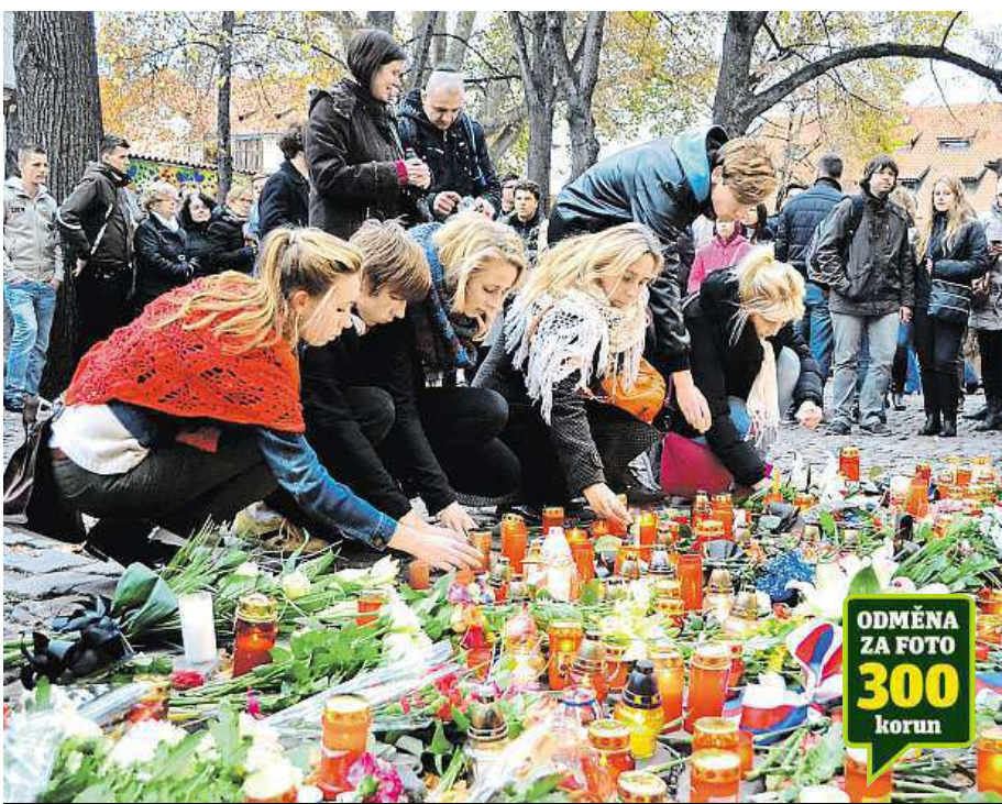
Před francouzské velvyslanectví na Malé Straně nosí lidé květiny a svíčky.