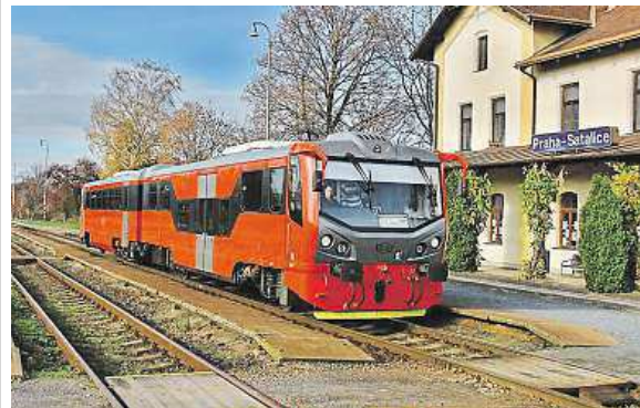
Ferda Mravenec vozil cestující v úterý 10. listopadu. PID