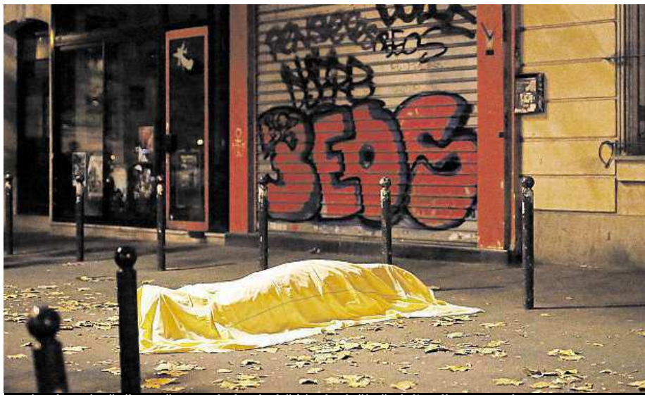
Snímek z pátečního večera. Zahalená oběť útoku leží před divadlem Bataclan.

„Byl jsem zrovna u kasy. Pak jsme uslyšeli exploze – opravdu hlasité rány. Všichni křičeli, začaly na nás padat skleničky. Bylo to hrozné. Uviděl jsem dvě ženy venku na terase. Trefili je. Jednu do zápěstí a jednu do ramena. Hodně krvácely,“ popisuje dramatické chvíle. Po ulici stále pobíhali útočníci a bezhlavě pálii do lidí. Navzdory