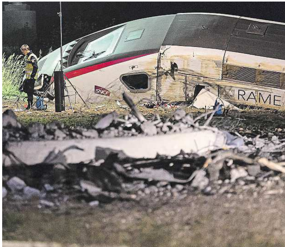
Nehoda se stala na trati mezi Paříží a Štrasburkem.