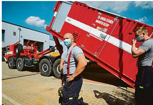
Tenhle stroj Čechy na holičkách nenechá. Na místo ho musí přivést hasiči se silnou Tatrou.