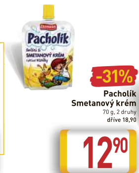
Pacholik Smetanový krém 70 g, 2 druhy dříve 18,90