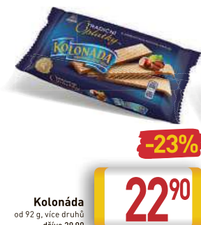
Kolonáda od 92 g, více druhů dříve 29,90