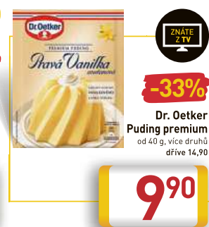
Dr. Oetker Puding premium od 40 g, více druhů dříve 14,90