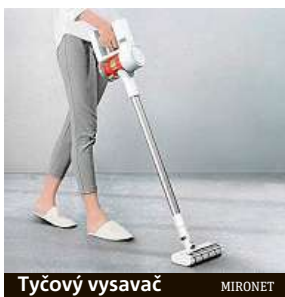
Tyčový vysavač MIRONET

Zpříjemnit si tento prodloužený pobyt na půdě našich domovů by mělo být snahou každého z nás, ať už kvůli naší duševní pohodě, nebo alespoň pro zabavení. Udržovat domácnost ale může být značně stereotypní a nudu