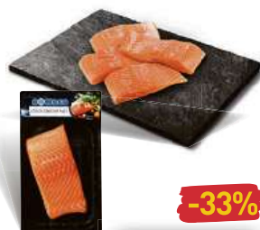
Losos filet chlazený cena za 100 g dříve 59,90