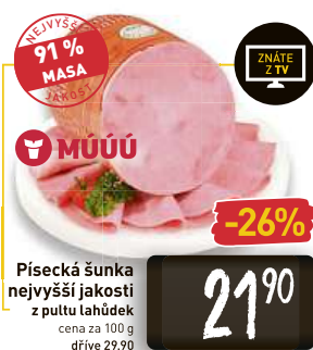
Písecká šunka nejvyšší jakosti z puttu lahůdek cena za 100 g dříve 29,90

Vládnoucí Novozélandská strana práce s premiérkou Jacindou Ardernovou si před parlamentními volbami drží náskok před opozičním uskupením. Premiérka získala podporu lidí díky zvládnutí pandemie, a to i za cenu přísných restrikcí.