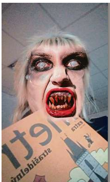
Tohle selfie poslal někdo, kdo se radši ani nepodepsal. Vůbec se nedíváme, ale doporučujeme návštěvu zubaře. A to velmi brzy.