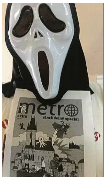
Michalu Rohlíkovi z Prahy 4 řadí v bytě divná bytost a nejraději má prý deník Metro. Inu, strašidla mají dobrý vkus!