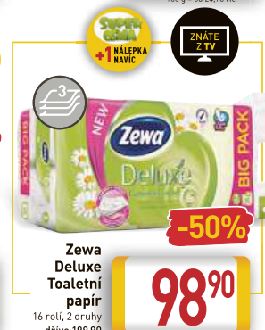
Zewa Deluxe Toaletní papír 16 rolí, 2 druhy dříve 199,90