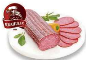
Bochník Madrid z puttu lahůdek cena za 100 g dříve 27,90