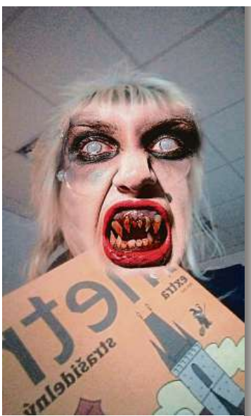
Tohle selfie poslal někdo, kdo se radši ani nepodepsal. Vůbec se nedíváme, ale doporučujeme návštěvu zubaře. A to velmi brzy.