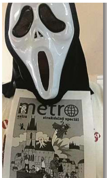
Michalu Rohlíkovi z Prahy 4 řadí v bytě divná bytost a nejráději má prý deník Metro. Inu, strašidla mají dobrý vkus!