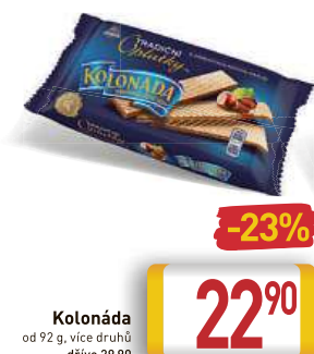
Kolonáda od 92 g, více druhů dříve 29,90