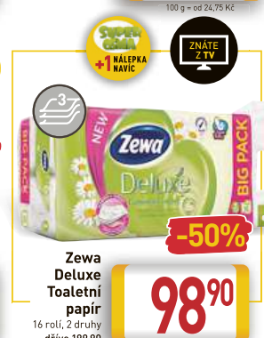
Zewa Deluxe Toaletní papír 16 rolí, 2 druhy dříve 199,90