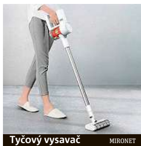
Tyčový vysavač MIRONET

Zpříjemnit si tento prodloužený pobyt na půdě našich domovů by mělo být snahou každého z nás, ať už kvůli naší duševní pohodě, nebo alespoň pro zabavení. Udržovat domácnost ale může být značně stereotypní a nudu