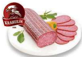
Bochník Madrid z puttu lahůdek cena za 100 g dříve 27,90