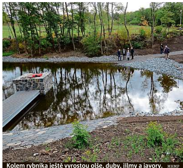
Kolem rybníka ještě vyrostou olše, duby, jilmy a javory.

Rybník Lipiny nyní ještě čekají poslední dodělávky, které tu magistrát teprve chystá. Během podzimu v něm ještě přibudou vysazené mokřadní rostliny tak, aby se rybník co nejdříve začlenil do okolní krajiny, magistrát nechá zatrávnit také okolí nádrže. „Na jaro 2019 je pak připravena dosadba stromů podél hrany rybníka. Vysázeny budou především stromy vázané na blízkost vody – jilmy, olše, duby letní a javory,“ doplňuje magistrát. FILIP JAROŠEVSKÝ