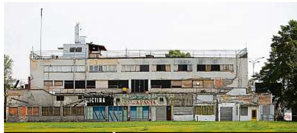
Fuchsova kavárna na Štvanici je v neutěšeném stavu.

VYDĚLEJTE SI ZA 2 MĚSÍCE 53 850 Kč A VÍCE