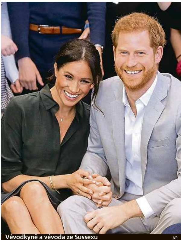
Vévodkyně a vévoda ze Sussexu

Harry a Meghan právě včera přistáli v Sydney, aby zahájili šestnáctidenní cestu po Austrálii, Novém Zélandu a jihopacifických ostrovních zemích Tonga a Fidži. Minulý pátek se zúčastnili svatby Harryho sestřenice Eugenie. Podle médií právě při té příležitosti oznámili zprávu o Meghanině těhotenství ostatním členům rodiny. Nyní čtyřiatřicetiletý princ Harry, vnuk královny Alžběty, který je šestým v pořadí následnictví na trůn, se oženil s o tři roky starší americkou herečkou Meghan Markleovou letos v květnu. Jejich dítě bude v pořadí následnictví na trůn na sedmém místě.