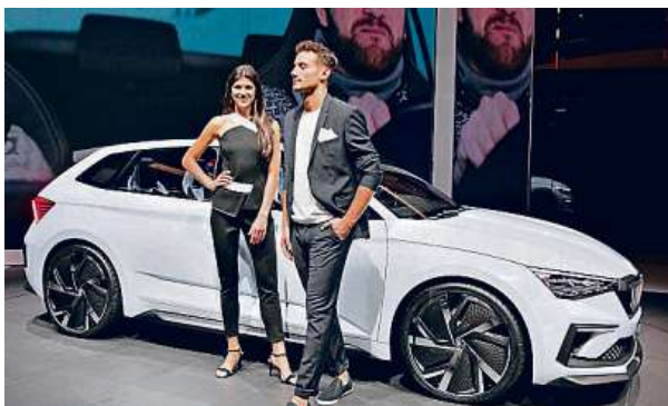
Koncept Vision RS byl představen v Paříži.