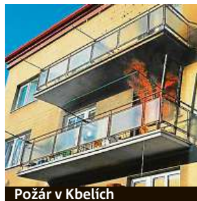
Požár v Kbelích