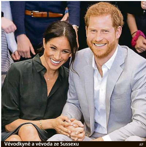
Vévodkyně a vévoda ze Sussexu

Harry a Meghan právě včera přistáli v Sydney, aby zahájili šestnáctidenní cestu po Austrálii, Novém Zélandu a jihopacifických ostrovních zemích Tonga a Fidži. Minulý pátek se zúčastnili svatby