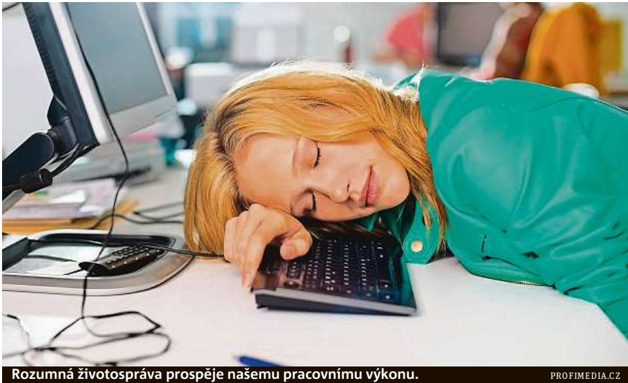
Rozumná životospráva prospěje našemu pracovnímu výkonu.