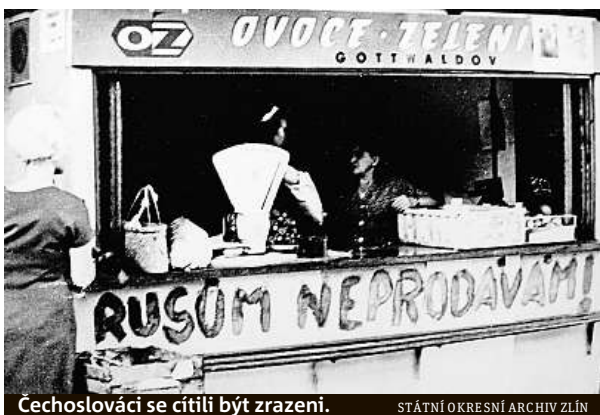
Čechoslováci se cítili být zrazení.

Do srpna 1968 jsme byli jedinou zemí na západní hranici sovětského bloku, kde neměl Kreml svá vojska. Ve středu 16. října 1968 podepsala naše vláda vnučenou dohodu, kterou pobyt okupačních vojsk zlegalizovala. O dva dny později stvrdil dokument i parlament. Poslední sovětský voják s rudou hvězdou opustil naše území