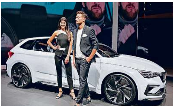
Koncept Vision RS byl představen v Paříži.