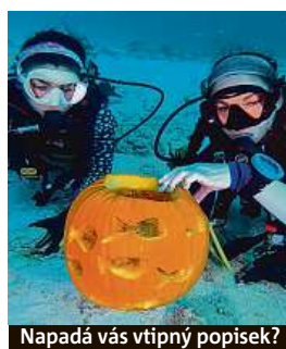
Napadá vás vtipný popisek?

Napište bublinu a reagujte na sloupek na: www.facebook.com/denikmetro