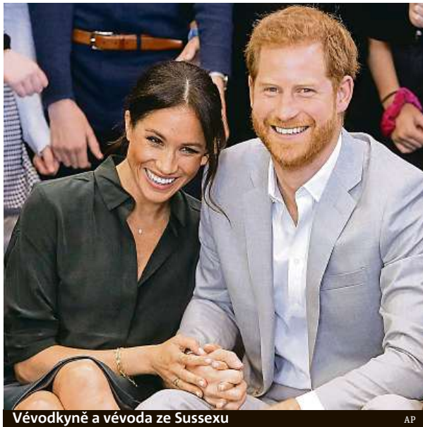
Vévodkyně a vévoda ze Sussexu

Harry a Meghan právě včera přistáli v Sydney, aby zahájili šestnáctidenní cestu po Austrálii, Novém Zélandu a jihopacifických ostrovních zemích Tonga a Fidži. Minulý pátek se zúčastnili svatby