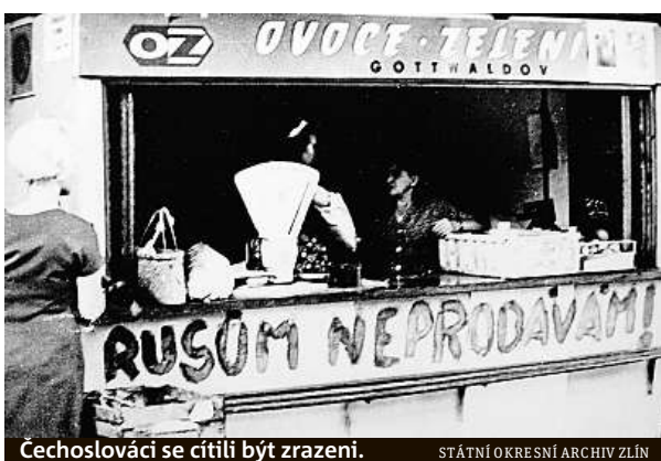
Cechoslováci se cítili být zrazení.

Do srpna 1968 jsme byli jedinou zemí na západní hranici sovětského bloku, kde neměl Kreml svá vojska. Ve středu 16. října 1968 podepsala naše vláda vnučenou dohodu, kterou pobyt okupačních vojsk zlegalizovala. O dva dny později stvrdil dokument i parlament. Poslední sovětský voják s rudou hvězdou opustil naše území