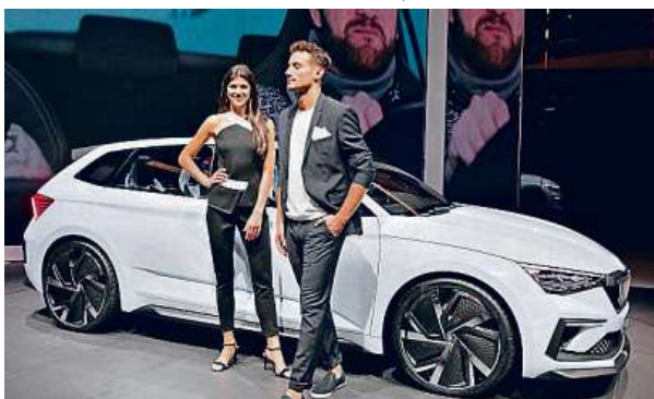
Koncept Vision RS byl představen v Paříži.