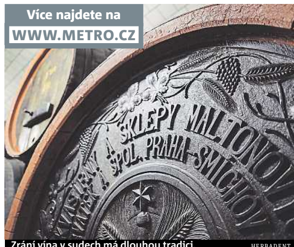
Zrání vína v sudech má dlouhou tradici.