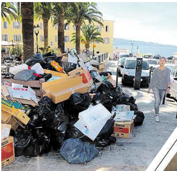
Hlavní město Korsiky Ajaccio

V letní sezoně se počet obyvatel Korsiky nadměrně zvýší. Turisté, zejména Němci,