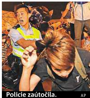
Policie zaútočila.