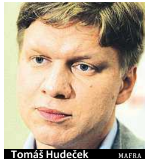
Tomáš Hudeček