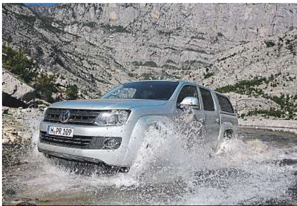
Volkswagen Amarok s dvojkabinou a nástavbou

Náš konvoj startuje z Tivatu, černo-horského letoviska v jadranském zálivu Kotor. Vzduch má skoro v polovině října 26 stupňů, voda příjemných dvaadvacet. Téměř se těšíme, až se v horách ochladíme. Klikatá silnička stoupá prudce vzhůru do pohorí Lovčen, odkud z orlí perspektivy fotíme nádhernou Boku Kotorskou. Ještě sjedeme dolů do Podgorici, hlavního města Černé Hory, a nad ní už jsou jedny krásnější hory než druhé. Komovi, Bjelasica, Pro-