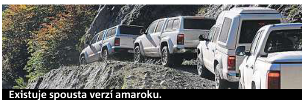
Existuje spousta verzí amaroku.

kletije. Štíty přesahující dva tisíce metrů obklopují malebná zelená údolí s modrými stužkami průzračných řek.