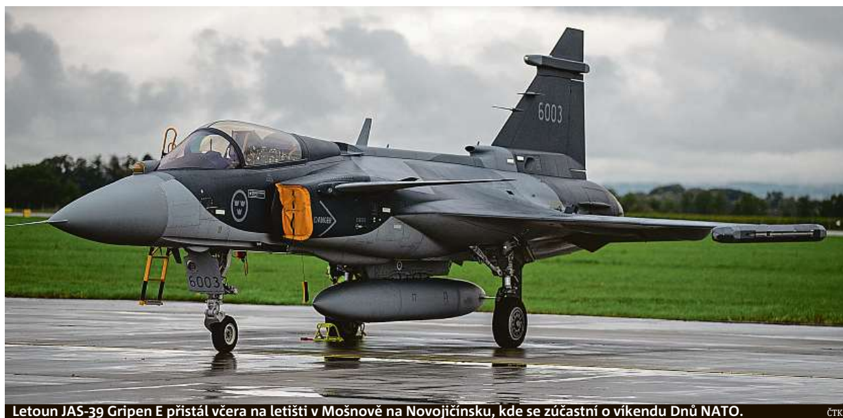
Letoun JAS-39 Gripen E přistál včera na letišti v Mošnově na Novojičínsku, kde se zúčastní o víkendu Dnů NATO.

Křížkování. Pozor na komunální volby, v nich se nekroužkuje. Téma. Zdražování energií řeší i obce STRANA 10