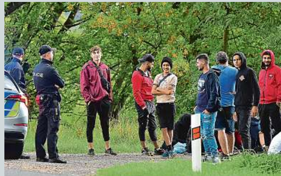
Migranti zadrženi u Rohatce na Hodonínsku