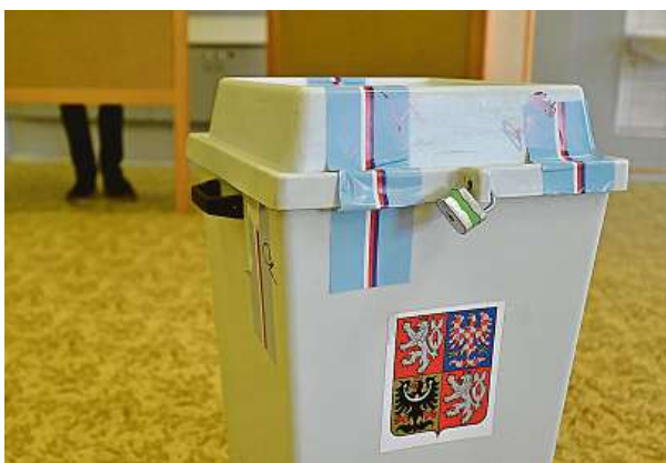
Obecní volby se konají 23. a 24. září.

Důvodů, proč se Čechům nechce do politiky, je víc. „Práce v místních zastupitelstvech a obecních úřadech je náročná, i časově, a přitom