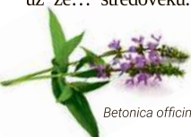
Betonica officinalis L.

Skutečnost, že mast, která dokáže zklidnit i velmi těžké pohmožděny a otoky, je velmi oblíbená, není žádným překvapením. Přičemž její složení může být inspirováno zápisy pocházejícími už ze... středověku. „V té době lidé samozřejmě nemohli využívat moderní ošetření ani