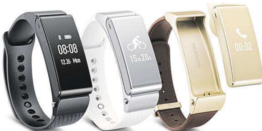
V náramku je ukryto Bluetooth sluchátko, které lze snadno vyjmout.

Uživatelský komfort při ovládní Huawei P8 je sám o sobě na velmi vysoké úrovni. I přesto je možné ho poměrně výrazně navýšit, a to díky nekonvenčním chytrým hodinkám nebo chcete-li fitness-náramku Huawei TalkBand B2. Ve společné kombinaci vytvářejí stylovou souhru připrave-