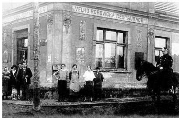
MICHAL KROUPA, ARCHIV