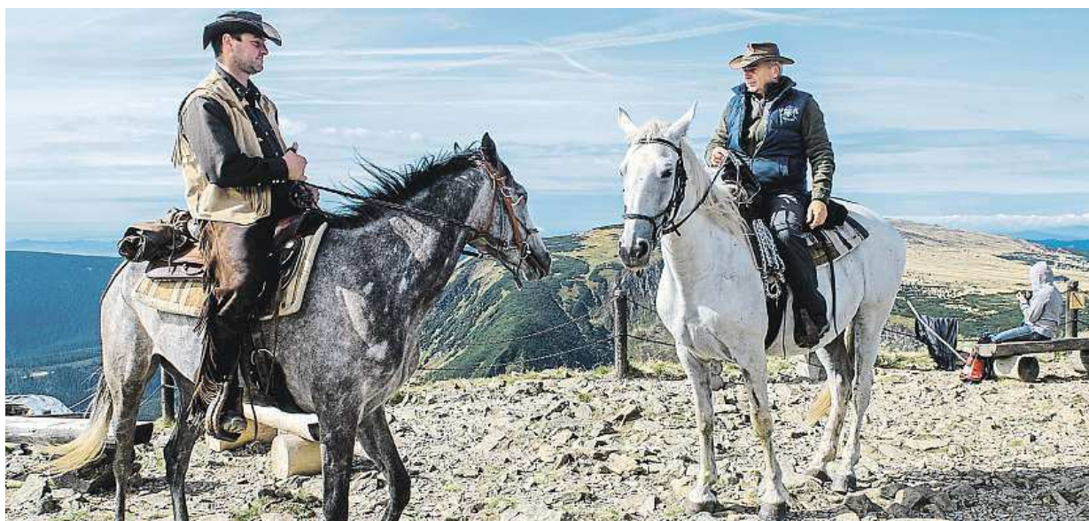
Na vrchol naší nejvyšší hory Sněžky včera vystoupalo ze Spindérova Mlýna, přes Výrovku a Luční boudu pět koní s jezdci.

ČTĚTE SPECIÁLNÍ PŘÍLOHU NA STRANÁCH 11 AŽ 14