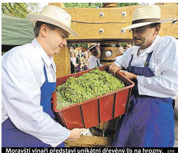
Moravští vinaři představí unikátní dřevěný lis na hrozny. SPH