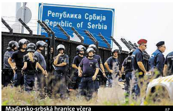
Maďarsko-srbská hranice včera

Maďarská vláda včera kvůli migrační vlně vyhlásila krizový stav ve dvou oblastech na jihu země přiléhajících k hranicím Srbska. Opatření má mimo jiné umožnit vyslání armády, aby pomohla policii střežit hranice, dále počítá s tím, že soudy budou přednostně řešit případy týkající se osob, které nelegálně vstoupí na maďarské území. Kromě toho by policie měla být zmocněna provádět domovní prohlídky bez soudního povolení, pokud bude mít podezření, že se v objektu nacházejí běženci. Včera také maďarský ministr zahraničí