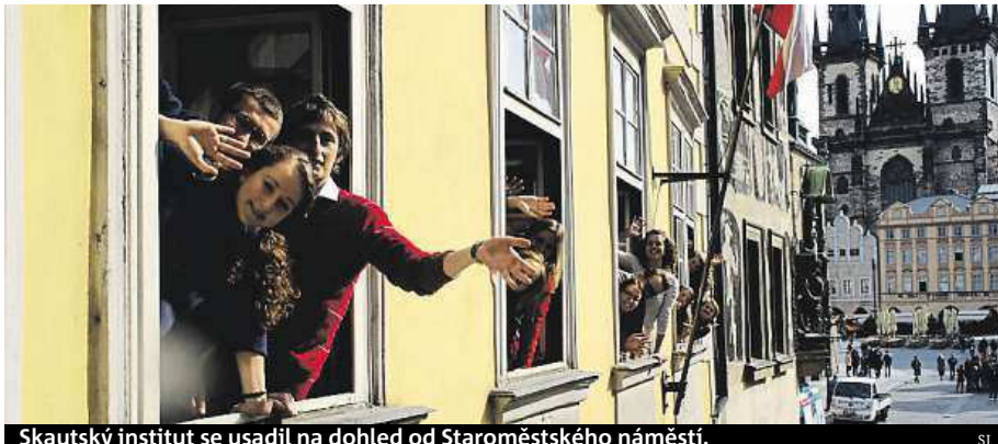
Skautský institut se usadil na dohled od Staroměstského náměstí.

Rozlehlý blok historických domů v sousedství radnice osířel, když se odtud odstěhovali úředníci. Teď do jednoho z domů vrací skauti život. Část domu U Zlatého rohu totiž magistrát půjčil Skautskému institutu. „Chceme tu postupně vybudovat místo setkávání nejen pro skauty, ale pro všechny mladé lidi,“ popisuje