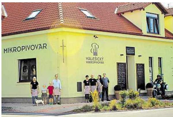
Malešický mikropivovar v roce 1900 a dnes. Výstava ukáže i další známá místa v této čtvrti.