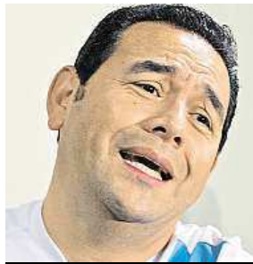
Jimmy Morales

Guatemalský komik Jimmy Morales se o prezidentský úřad této středoamerické země utká s bývalou první dámou.