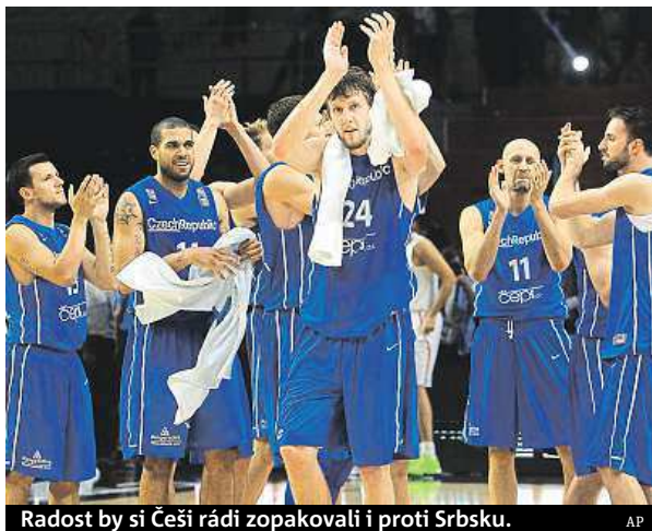
Radost by si Češi rádi zopakovali i proti Srbsku.

Pro český tým je navíc motivací i šance na olympijské hry. Vítěz čtvrtfinále už bude mít jistou kvalifikaci a navíc bude držet šanci na přímý postup. Zápas začíná ve francouzském Lille v 18.30 hodin. PAVEL URBAN a ČTK