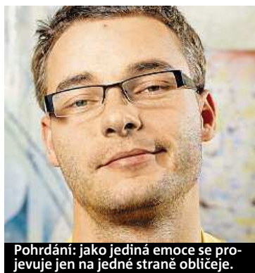
Pohrdání: jako jediná emoce se projevuje jen na jedné straně obličeje.

Obličej tě prozradí. Do Česka dorazila nová metoda, která odhaluje skryté emoce.