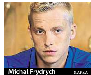
Michal Frydrych MAFRA

Městský soud v Praze včera také odročil jednání o insolvenčních návrzích proti Slavii na 3. listopadu. Klub už uhradil splatné závazky. PUR