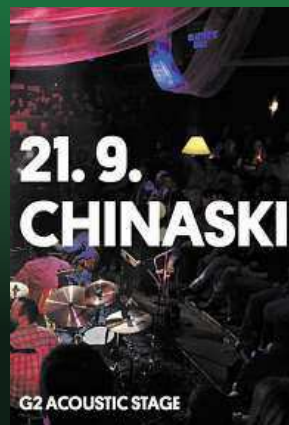
G2 ACOUSTIC STAGE