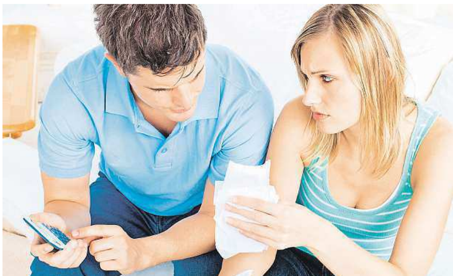
Každý by si měl důkladně propočítat, zda je schopen úvěr splácet.

V kalkulačce Hypoteční banky si klienti podle Mockové nejčastěji volí fixaci na pět let dopředu. Součástí těchto kalkulaček také bývá zadávání osobních parametrů, jako je vztah žadatelů, počet dětí či výše čistých měsíčních příjmů. „Všechny parametry vezme kalkulačka následně v potaz a spočítá předběžnou výši splátky a úrokové sazby,“ dodává Mocková. Ne všechny kalkulačky však pracují s takto podrobným zadáním a u některých bank tak stačí klientům zadat pouze něko-