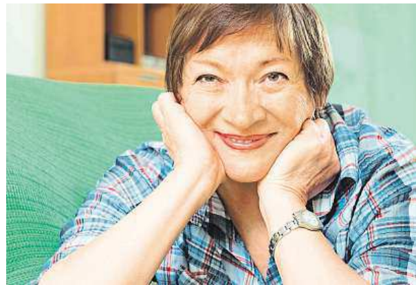
Senioři si k penzi můžou přilepšit.

Před tímto produktem varuje také Česká národní banka. „Považujeme produkt ‚zpětné hypotéky‘ za velmi rizikový, protože ten, kdo prodá nemovitost s příslibem budoucích plateb, může v případě úpad-