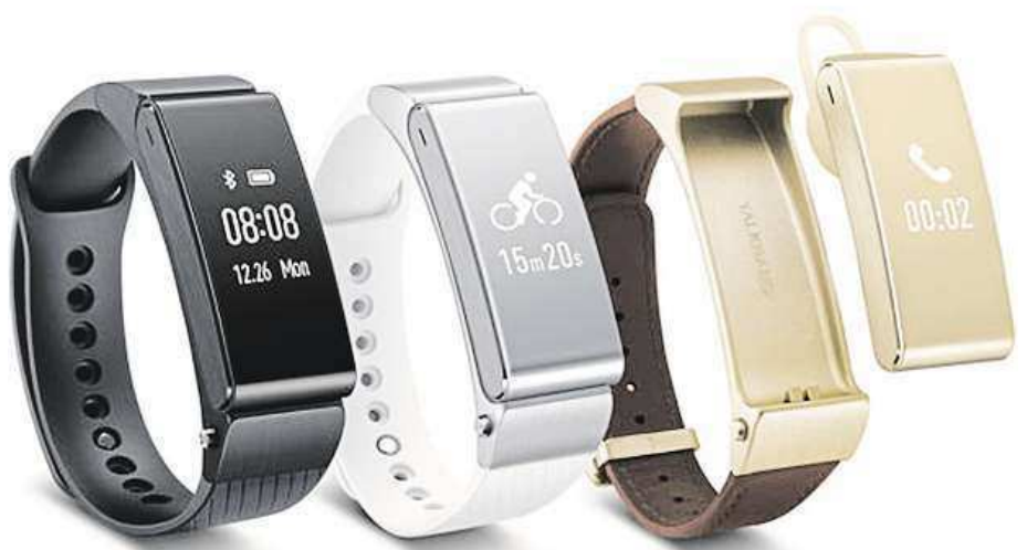
V náramku je ukryto Bluetooth sluchátko, které lze snadno vyjmout.

Kromě obvyklých funkcí, na něž jsme u chytrých náramků zvyklí, tak TalkBand B2 nabízí i vychytané handsfree. Mezi jeho další přednosti patří propracovaná sada fitness-aplikací s širokou nabídkou činností, které dokáže monitorovat. Od základní chůze, běhu a cyklistiky vám například dokáže pohledat pitný režim a včas připomenout, kdy se máte jít napít. Nemusíte nic složité nastavovat, náramek sám rozpozná,