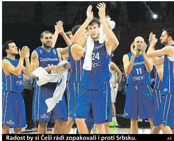
Radost by si Češi rádi zopakovali i proti Srbsku.

Pro český tým je navíc motivací i šance na olympijské hry. Vítěz čtvrtfinále už bude mít jistou kvalifikaci a navíc bude držet šanci na přímý postup. Zápas začíná ve francouzském Lille v 18.30 hodin. PAVEL URBAN a ČTK