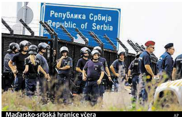
Maďarsko-srbská hranice včera

Maďarská vláda včera kvůli migrační vlně vyhlásila krizový stav ve dvou oblastech na jihu země přiléhajících k hranicím Srbska. Opatření má mimo jiné umožnit vyslání armády, aby pomohla policii střežit hranice, dále počítá s tím, že soudy budou přednostně řešit případy týkající se osob, které nelegálně vstoupí na maďarské území. Kromě toho by policie měla být zmocněna provádět domovní prohlídky bez soudního povolení, pokud bude mít podezření, že se v objektu nacházejí běženci. Včera také maďarský ministr zahraničí