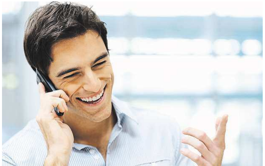
Kromě skvělých funkcí je Huawei také povedeným designovým kouskem.

Největší pozornost byla upřena na zdokonalení fotoaparátu, u nějž byl vůbec poprvé mezi mobilními telefony použit čtyřbarevný RGBW senzor. Ten se posta-