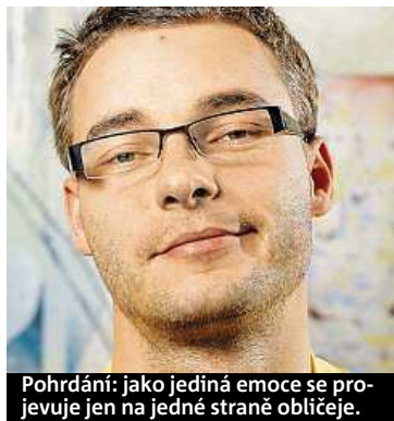
Pohrdání: jako jediná emoce se projevuje jen na jedné straně obličeje.

Obličej tě prozradí. Do Česka dorazila nová metoda, která odhaluje skryté emoce.