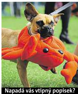
Napadá vás vtipný popisec?

Napište bublinu a reagujte na sloupek na: www.facebook.com/denikmetro