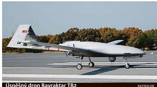
Uspěšný dron Bayraktar TB2

Společnost Baykar dále pracuje na projektu bezpilotní stíhačky s názvem Bayraktar Kizilelma a chce zvýšit svou výrobní kapacitu. Doufá, že toho dosáhne právě díky závodu na Ukrajině. „Ukrajinu vnímáme jako strategického