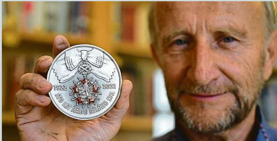
Stříbrná pamětní medaile ke 100. výročí vzniku nejvyššího státního vyznamenání ČTK

Vandalismus dál komplikuje železniční dopravu v Česku. Nejčastěji jde o případy graffiti na vlacích. Dopravce stojí miliony korun ročně, vedle toho navíc kvůli čištění vlaků dočasně omezují přepravní kapacitu spojů. České dráhy loni odstranily pětistovku nápisů. Za jejich odstranění podnik zaplatil 5,8 milionu korun. ČTK