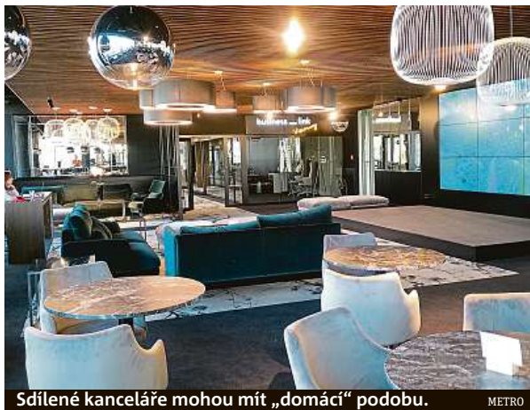
Sdílené kanceláře mohou mít „domácí“ podobu.