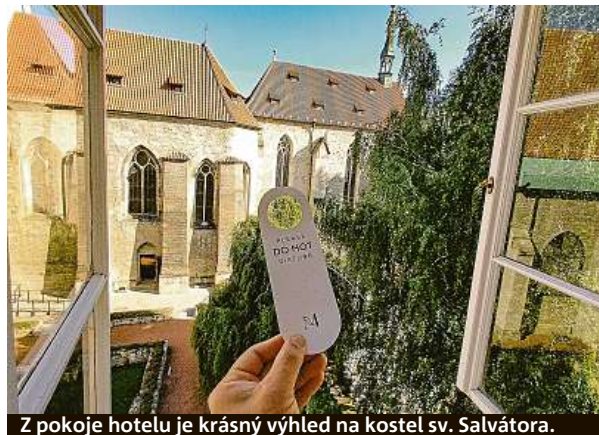
Z pokoje hotelu je krásný výhled na kostel sv. Salvátora.