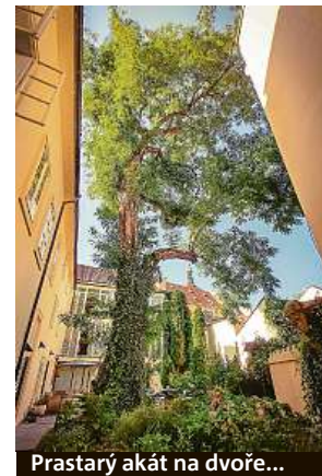
Prastarý akát na dvoře...

Výlet do Prahy? Proč ne! I Pražáci zde mohou zažít nečekaná překvapení, když se z nich stanou turisté.