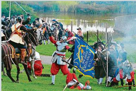
Uspěli proti Švédům při obraně Brna.