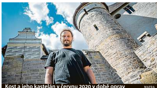
Kost a jeho kastelán v červnu 2020 v době oprav

Kost je pro veřejnost znovu otevřen šest dní v týdnu. Rekonstrukce začala na podzim 2019. „Udělal se kompletní odvodnění celého horního areálu a oprava povrchů včetně doplnění dlažeb. Sanovaly se veškeré hradby a skalní masív, na kterém samotný hrad stojí. Cílem bylo stabilizovat skalní masív a zabránit