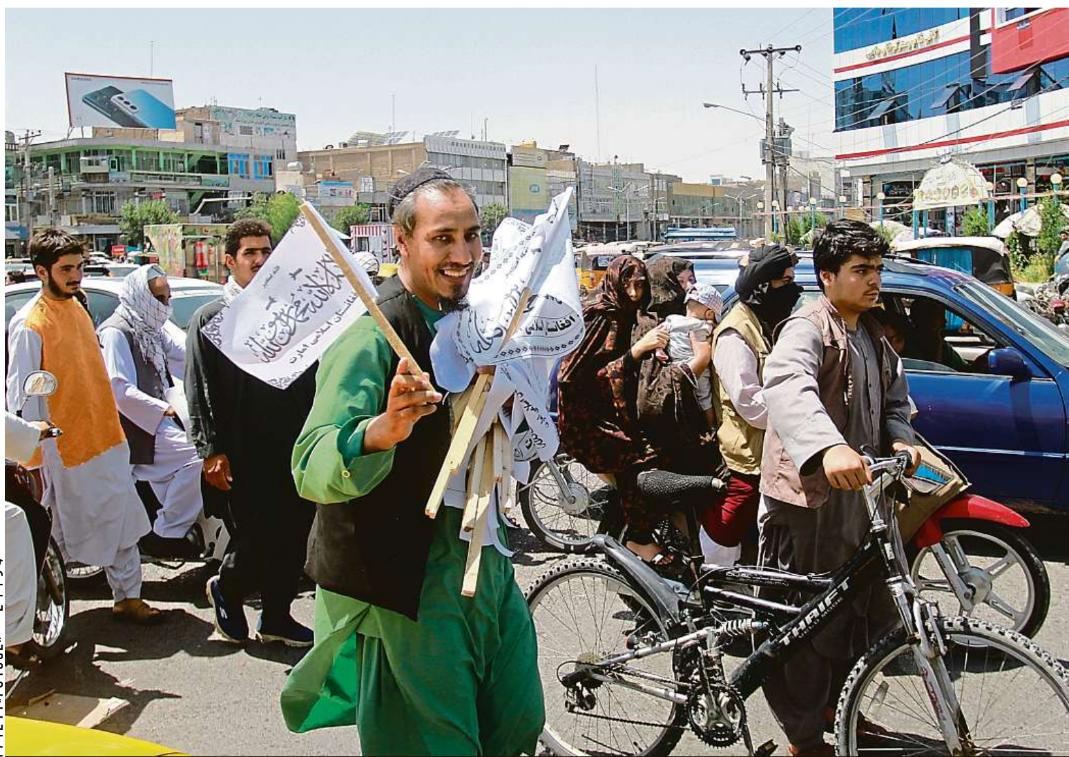
Chaos v Kábulu. Radikální islamistické hnutí Tálibán včera vstoupilo do afghánského hlavního města. Prezident opustil zemi. Více čtěte na straně 6.

Výzva. Hoteliéři v hlavním městě lákají Čechy včetně samotných Pražáků. Výhody. „Máme ceny nízké a město si užijete jako nikdy,“ říkají. Úžasné hotely. Jaké designové skvosty můžete vyzkoušet? STRANA 8