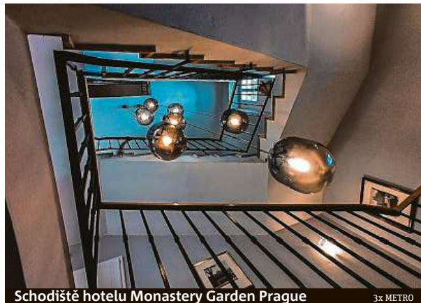
Schodiště hotelu Monastery Garden Prague