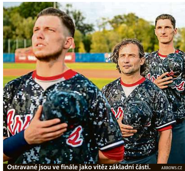
Ostravané jsou ve finále jako vítěz základní části.

Série na tři vítězné zápasy startuje dnes v Ostravě. Kdo zvedne pohár a nasadí vítězné prsteny, může být známo už v neděli a nejspíše v sobotu 24. srpna. Finále extraligy se hraje v rychlém tempu – už 7. září startuje ME, na kterém musí Češi skončit do 5. místa, aby se dostali do olympijské kvalifikace. čtr