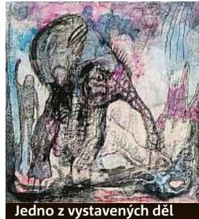
Jedno z vystavených děl