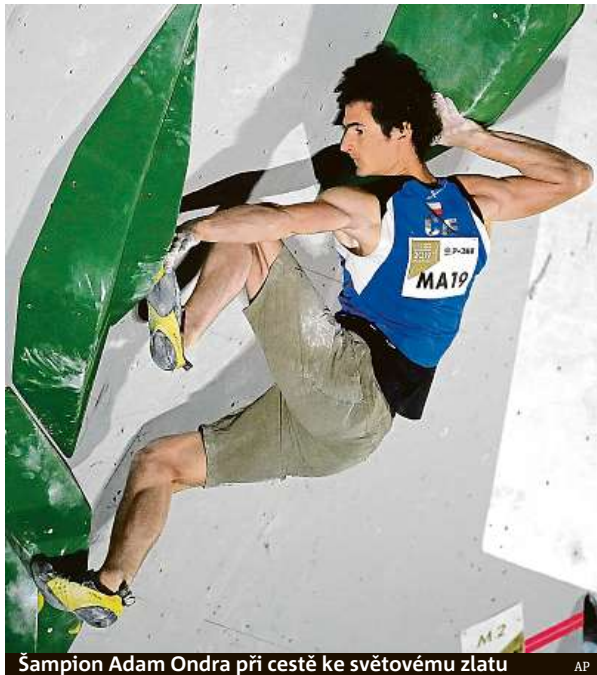
Šampion Adam Ondra při cestě ke světovému zlatu