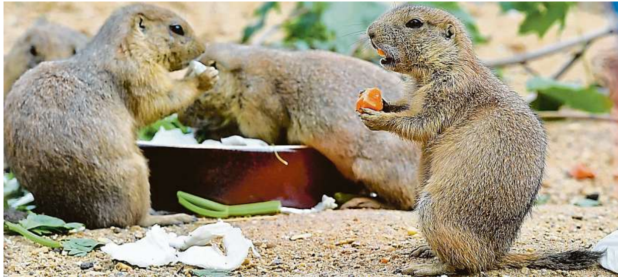
Zoologická zahrada v Praze-Troji otevřela novou expozici psounů prériových.

Motor běží. Nastartované dopravní prostředky mají uvnitř udržet příjemnou teplotu. Litera zákona. Jde o přestupek, hrozí pokuta 2500 korun. Zbytečné zplodiny. Trápí všechna turisticky zajímavá místa STRANA 4