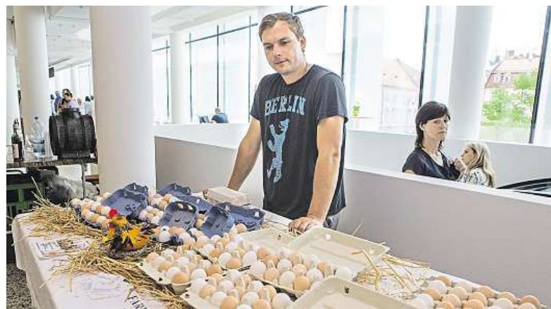
V nabídce tržnice jsou i čerstvá vajíčka od farmářů.

V přízemní pasáži se nachází Matějovo pekařství, Jazzová kavárna Podobrazy a dětský koutek. BAB