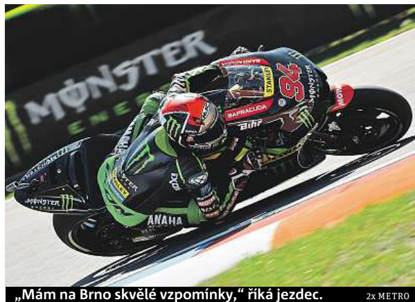
„Mám na Brno skvělé vzpomínky,“ říká jezdec.

ne, nehraje zas až takovou roli. Jakmile jste na trati, už to neřešíte. Ale je pravda, že s domácí Grand Prix je spojený větší zájem fanoušků, řada doprovodných akcí... Já to vlastně v takovém rozsahu zažil teď na Sachsenringu poprvé, byla to pro mě nová zkušenost. Kategorie MotoGP je z hlediska zájmu fanoušků úplně jiný svět oproti nižším kubaturám. Ale já jsem si to docela užíval a energii od fanoušků pak přetavil v dobrý výsledek.