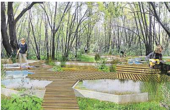
Takto by mohly Hády vypadat.