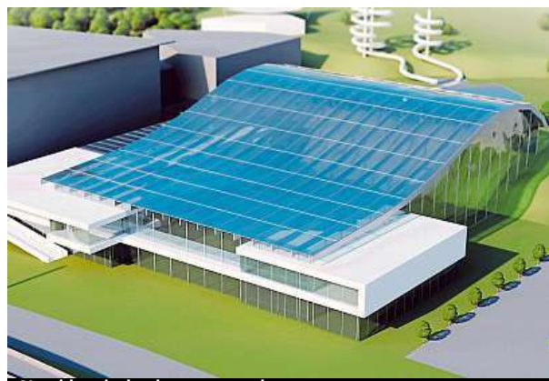
Nový bazén bude ve tvaru vlny.