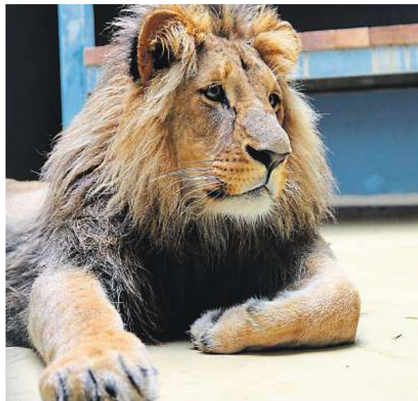
Nový král brněnské zoo Lolek