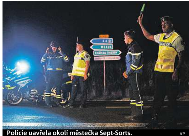
Policie uzavřela okolí městečka Sept-Sorts.

Tajně službě ani policii prý nebyl znám. Řidič narozený