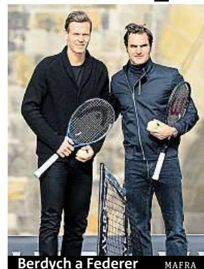
Berdych a Federer

Diváci se na Laver Cupu můžou těšit na ostré zápasy. O exhibici, jako je třeba zimní asijská liga, nejspíše nepůjde. „Může k tomu vybízet, že to je nový formát a není to pod ATP či ITF, ale půjdeme