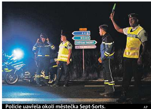
Policie uzavřela okolí městečka Sept-Sorts.

Tajně službě ani policii prý nebyl znám. Řidič narozený