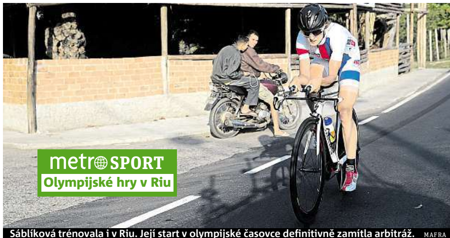
Sáblíková trénovala i v Rio. Její start v olympijské časovce definitivně zamítla arbitráž.