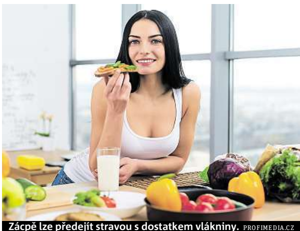
Zácpě lze předjet stravou s dostatkem vlákniny.

Pokud nechodíte na toaletu každý den, nic se neděje. Denní vyprazdňování není určujícím ukazatelem správné funkce střev. Důležitější je,