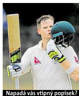
Napadá vás vtipný popisek?

Napište bublinu a reagujte na sloupek na: www.facebook.com/denikmetro