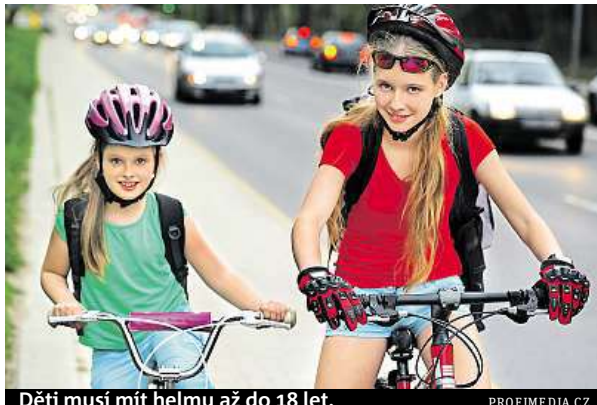
Děti musí mít helmu až do 18 let.

Zranění na kole přitom již alespoň jednou zažilo 30 procent dětí, každé třinácté pak muselo být ošetřeno lékařem či hospitalizováno. Podle zkušeností z pražské Thomayerovy nemocnice většina dětských cyklistických úrazů patří ke středně závažným či závažným zraněním a vyžaduje hospitalizaci. Nejčastější jsou zlomeniny dlouhých kostí horních končetin, hlavně v okolí loketního kloubu. Takové úrazy vyžadují operaci a nemusejí se zhojit bez následků. „Převládají pády z kola při smyku, najetí do prohlubně, na obrubník chodníku, zídku a podobně. Mezi dopravními úrazy zaznamenáme sražení cyklisty osobním automobilem, srážku dvou cyklistů, cyklisty