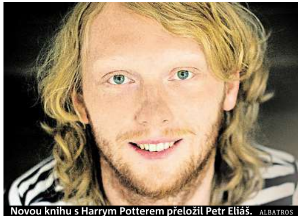
Novou knihu s Harrym Potterem přeložil Petr Eliáš. ALBATROS

Ano, je. S jejím stylem a s překladem bratrů Medkových se však průběžně seznamuji poměrně detailně, mimo jiné při revizích pro nová vydání s ilustracemi Jima Kaye.