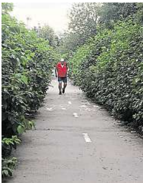
Zarostlá cyklostezka METRO

„Cyklostezku A 222 ve správě máme. Podle fotografií keře zasahují z pozemku ve