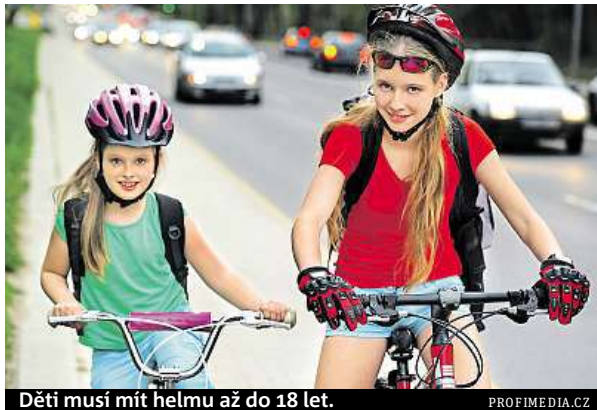
Děti musí mít helmu až do 18 let.

Zranění na kole přitom již alespoň jednou zažilo 30 procent dětí, každé třinácté pak muselo být ošetřeno lékařem či hospitalizováno. Podle zkušeností z pražské Thomayerovy nemocnice většina dětských cyklistických úrazů patří ke středně závažným či závažným zraněním a vyžaduje hospitalizaci. Nejčastější jsou zlomeniny dlouhých kostí horních končetin, hlavně v okolí loketního kloubu. Takové úrazy vyžadují operaci a nemusejí se zhojit bez následků. „Převládají pády z kola při smyku, najetí do prohlubně, na obrubník chodníku, zídku a podobně. Mezi dopravními úrazy zaznamenáme sražení cyklisty osobním automobilem, srážku dvou cyklistů, cyklisty