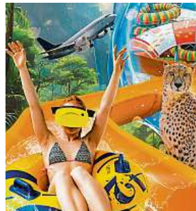
Hranice zábavy a inovací se opět posouvají. AQUAPALACE PRAHA

Návštěvníci Aquapalace Praha se nyní mohou díky pokročilé technologii VR, která zahrnuje nejen vizuální, ale i zvukové efekty, ponořit během jízdy na vodní atrakci do fantastických světů. Novinka umožňuje výběr ze dvou příběhů. V prvním se návštěvníci mohou stát dobrodruhy a prožít průjezd džunglí, kde je obklopí exotická fauna a flóra, zvuky pralesa a nečekané překážky. Druhý příběh nabízí stát se pilotem, což přináší úplně nový pohled na tobogán, jako by byl