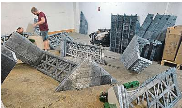
Takhle se v pražských Počernicích skládala 3D vytištěná kopie Eiffelovy věže.