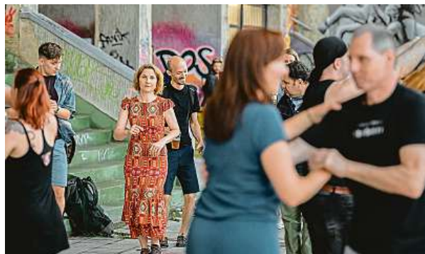
Strahovský stadion je stadion s největší rozlohou na světě. Jeho betonové tribuny jsou zapsány na seznamu kulturních památek.

„Dále je pro návštěvníky připravená šifrovaná hra Mráz na Strahově. Ta hráče zavede na první pohled do skrytých míst Strahovského stadionu a zároveň odhalí za-