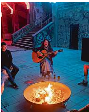
Stadion Strahov zase žije! Někdy i zpěvem a tancem.

„I tento rok jsme společně s hlavním městem a Prahou 6 připravili pestrý program v netradičních prostorách Stadionu Strahov. K vidění bude například komiksová výstava Ještě jsme ve válce, v které přední čeští a slovenští výtvarníci představují příběhy lidí, kteří bojovali na válečné frontě, prošli koncentračními tábory či komunistic-