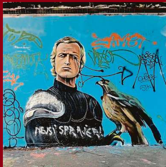
Kdo z vás se narodil v 70. letech, určitě ví, která bije. Na Těšnově „přistál“ pohádkový velkořemeslník Jestřábí žena. Mimořádně ztvárněný hercem Rutgerem Hauerem je vysprejován fakt zdařile! #prahagraffiti #grafflife #graffitiart #streetartpraha #streetartpraga