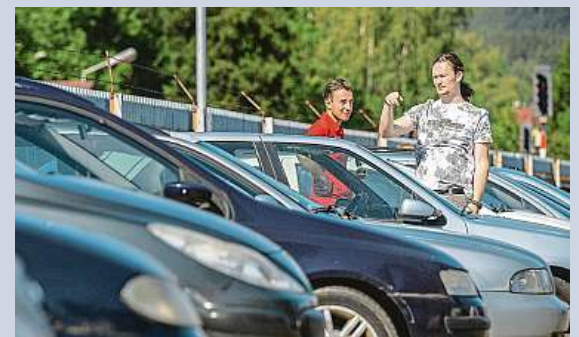
Dražba odtahovaných vozidel z libereckých ulic