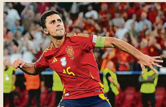
Rodrigo Hernández Cascante, známý jako Rodri, hraje anglickou Premier League za Manchester City.

Individuální ocenění na mistrovství Evropy vybral tým 12 technických pozorovatelů UEFA. Mezi ně patřili převážně současní či bývalí trenéři.