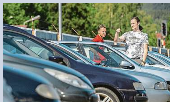
Dražba odtazených vozidel z libereckých ulic