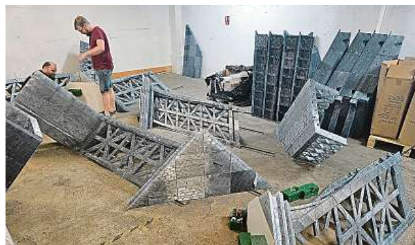
Takhle se v pražských Počernicích skládala 3D vtištěná kopie Eiffelovy věže.