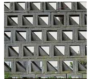
A originál na Pankráci