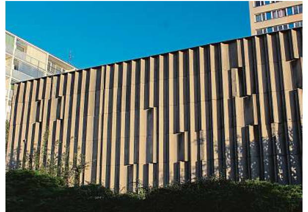
Reliéf najdete naproti budově V Tower.