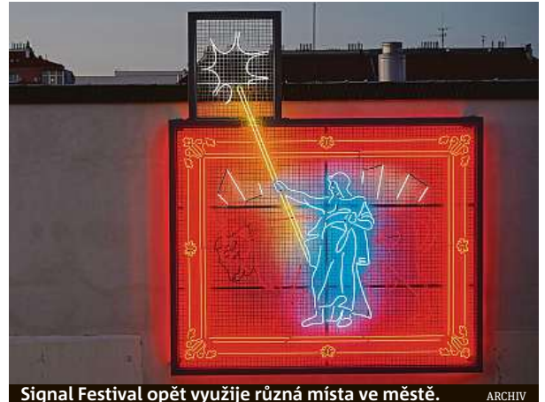
Signal Festival opět využije různá místa ve městě.

Festivalové téma loňského zrušeného ročníku znělo Plan B a mělo se věnovat sou-