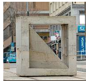
Plastika u muzea