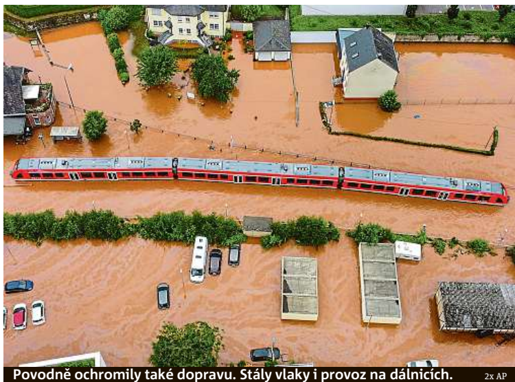
Povodně ochromily také dopravu. Stály vlaky i provoz na dálnicích.

Česko chtělo vyslat hasiče. Němci situaci zvládají vlastními silami.