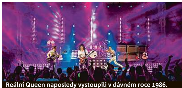
Reální Queen naposledy vystoupili v dávném roce 1986.

„Myslím, že nemusím dlouze vysvětlovat, co pro nás koncert na domácí pražské půdě znamená. Stejně jako