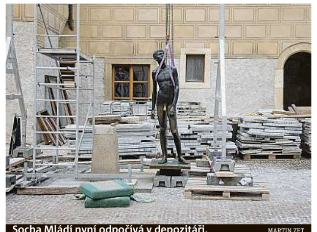
Socha Mládí nyní odpočívá v depozitáři.