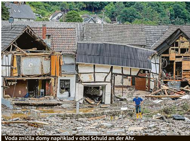
Voda zničila domy například v obci Schuld an der Ahr.