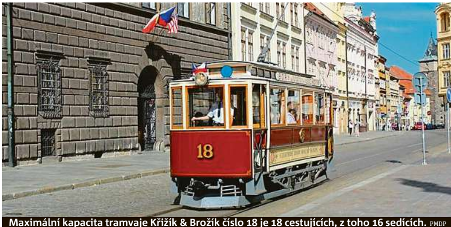
Maximální kapacita tramvaje Křižík & Brožík číslo 18 je 18 cestujících, z toho 16 sedících. PMDP

Průvod vyjede z nástupní stanice Královka v 8.15 a pojedou centrem města přes Pražský hrad a Karlovo a Václavské náměstí. Na konečnou stanici Letenské náměstí by měl průvod historických i novodobých vozů dorazit okolo deváté hodiny. Zájemci zaplatí podle informací na webu dpp.cz za jízdenku 50 korun. Ve fanshopu DPP si můžete rovněž zvolit, kterým vozem se chcete svést.