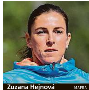
Zuzana Hejnová

Šampionka z let 2013 a 2015 se na olympijské hry kvalifikovala splněním ostrého limitu mezinárodní federace v roce 2019. I když v olympijské sezoně vůbec nevyběhla, svaz ji zařadil do týmu. Už při odhlášení z mistrovství republiky ale Hejnová avizovala, že na olympiádu nechce odjet