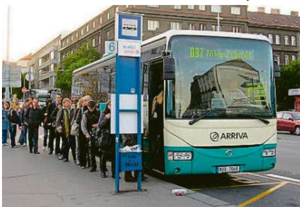
Kvůli integraci Příbramska se musely busy přesunout z obratiště Na Knížecí (vlevo) na zastávku Smíchovské nádraží.

„Požadujeme zachování konečné zastávky příbramských autobusů na Praha, Na Knížecí z těchto důvodů: návaznost na další spoje, zvýšená kriminalita v oblasti smíchovského nádraží a omezená dostupnost občerstvení a služeb,“ uvádějí obyvatelé Příbrami v petici, kterou se snažili přesunu konečné na