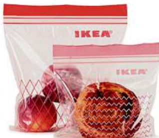
ISTAD, uzavíratelné sáčky. 49,-/60 ks Polyetylenový plast. 30x0,4 l a 30x1 l.