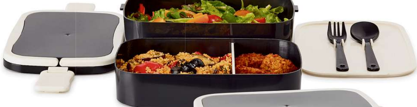
FLOTTIG, krabička na oběd. 99,- Plast. 22x13, v. 12 cm.