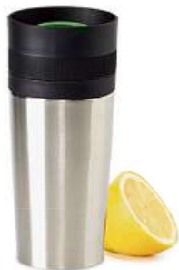
EFTERSÖKT, cestovní hrnek. 249,- Nerezavějící ocel, silikonová pryž, plast. 35 cl.