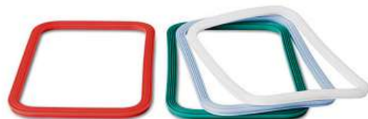
IKEA 365+, těsnění. 79,-/4 ks Silikonová pryž.