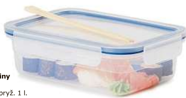
IKEA 365+, dóza na potraviny s víkem. 69,- Plast, silikonová pryž. 1 l.