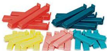
BEVARA, sada 30 ks uzávěrů sáčků. 39,- Plast.