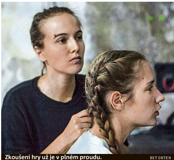
Zkoušení hry už je v plném proudu.