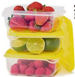
PRUTA, dóza na potraviny. 29,-/3 ks Plast. 14x14, v. 6 cm.