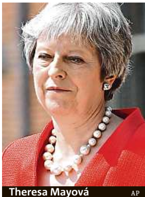
Theresa Mayová

Minulý týden rezignovali na svou funkci šéf britské diplomacie Boris Johnson a mi-