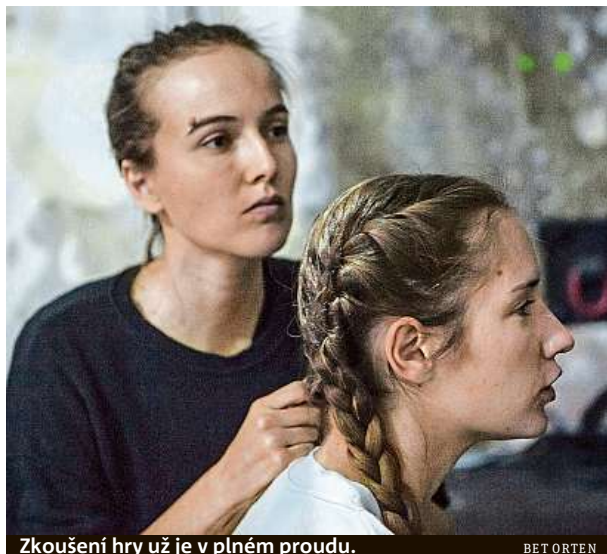
Zkoušení hry už je v plném proudu.