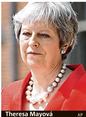
Theresa Mayová

Minulý týden rezignovali na svou funkci šéf britské diplomacie Boris Johnson a mi-