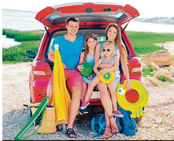
Udělejte si seznam, ať na nic nezapomenete.

Pokud se rozhodnete pro cestu vlastním vozem, je určité vhodné ho nechat zkontrolovat v servisu. A také se na dlouhou jízdu dobře připravit. Podle průzkumu společnosti Europ Assistance věří třicet procent řidičů GPS navigaci, v těsném závěsu jsou mobilní aplikace (28 procent). Na cestě pak trpí tělo, nejčastěji