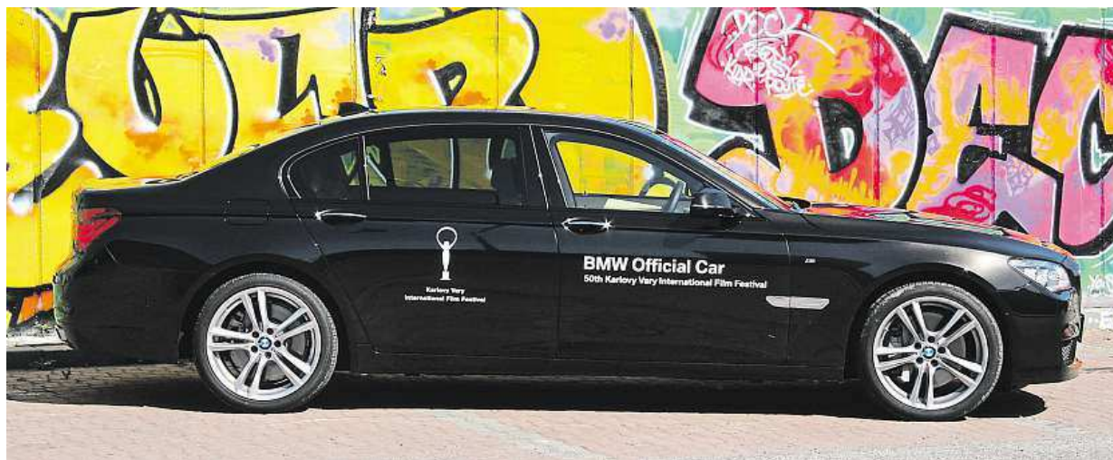
5219 milimetrů – to je přesná délka tohoto luxusního čahouna. Kola mají dvacet palců.