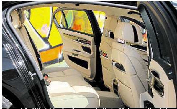
Dovnitř přišla kůže. Dveře se otvírají téměř do pravého úhlu.

Ale zpátky k jízdě. Tři turbodmychadla fungují jako správná koalice a motor má úctyhodné síly, při rozjezdu připlácnete posádce jejich smartphony na obličej. Šestiválec má sílu 381 koní a 740 Nm při 2000 otáčkách za minutu. Ve spojení s osmistupňovou převodovkou umí dynamicky nastoupit i řídit „úspornou“ jízdu. V ostrých zatáčkách se limuzína nenaklání, drží dobře stopu, čtyřkolka se intuitivně řídí po-