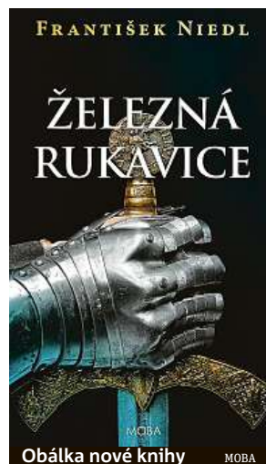
Obálka nové knihy