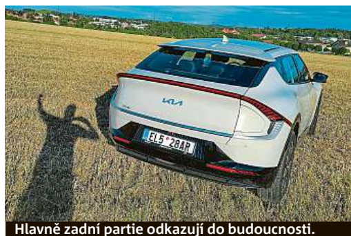
Hlavně zadní partie odkazují do budoucnosti.

Jízdě je auto na velmi vysoké úrovni. Díky tepelnému čerpadlu získávajícímu odpadní teplo z chladicí soustavy a chytrým brzdám skvěle rekuperuje a uchovává energii. Podvozek laděný někde mezi polohami Tvrdák a Pohodár je výborný a auto drží sebejistě i při rychlém průjezdu zatáčkou. Má skvělou dynamiku a mnohdy máte pocit, že řídíte sportovní a povedený vůz. PETR HOLEČEK