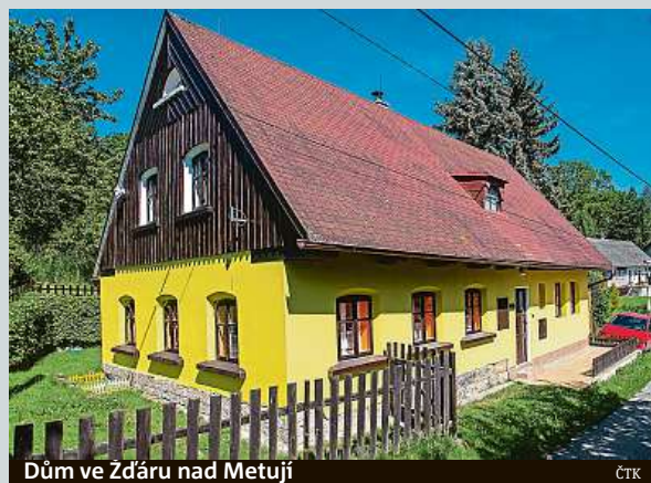
Dům ve Žďáru nad Metují

Další kraj má svého regionálního vítěze v soutěži Vesnice roku. Do celorepublikového klání pojede za Královéhradecký kraj Žďár nad Metují na Náchodsku. ČTK