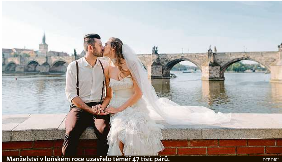
Manželství v loňském roce uzavřelo téměř 47 tisíc párů.

Česko se do první desítky zdaleka nedostalo. Teprve na 68. pozici se jako nejdraž-