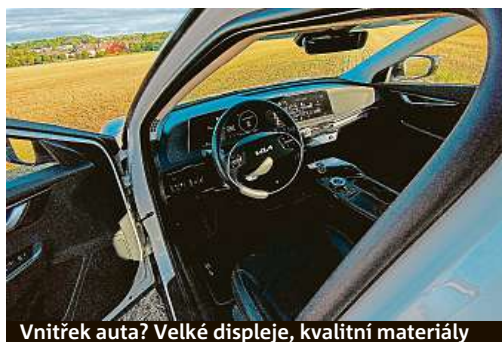
Vnitřek auta? Velké displeje, kvalitní materiály