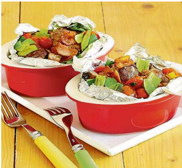
Takhle krásně může vypadat kuře podle receptu.

Šéfkuchaři obvykle nedají při grilování dopustit z drůbeže hlavně na krůtu, nejlépe se hodí prsa a celá stehna.