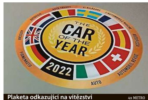
Plaketa odkazující na vítězství