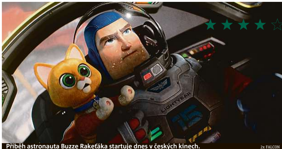
Příběh astronauta Buzze Raketáka startuje dnes v českých kinech.

Figurka Buzze Raketáka z oblíbeného animáku Příběh hraček vznikla podle fiktivního dobrodružného „filmu ve filmu“. Ten se nyní zhmotňuje v kinech.