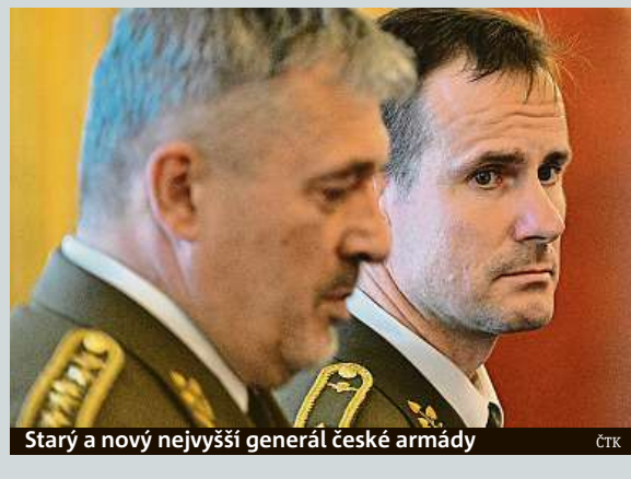
Starý a nový nejvyšší generál české armády

Karel Řehka. To je jméno nového náčelníka generálního štábu armády. Střídá Aleše Opatu. Řehka, ředitel Národního úřadu pro kybernetickou a informační bezpečnost a exvelitel armádních speciálních sil, nastoupí v červenci. Do funkce ho na Hradě jmenoval prezident Miloš Zeman. Řehka působil v misích na Balkáně a v Afghánistánu a ve velitelských strukturách NATO. ČTK