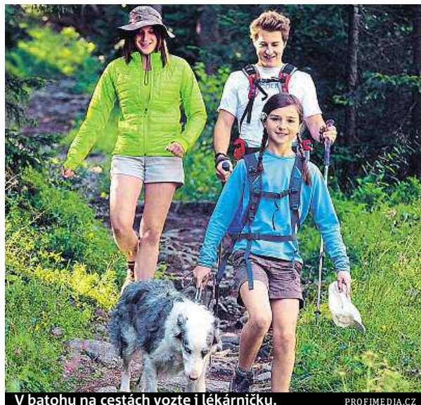
V batohu na cestách vozte i lékárníčku.

Zvláště nebezpečná je alergie na žihadlo od včely, vosy nebo sršně. Může vyvolat ana-