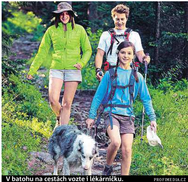
V batohu na cestách vozte i lékárníčku.

Zvláště nebezpečná je alergie na žihadlo od včely, vosy nebo sršně. Může vyvolat ana-