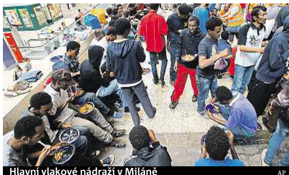
Hlavní vlakové nádraží v Miláně

Běženci chtějí zamířit dál do Evropy, ale Rakousko a Francie v posledních dnech na hranicích s Itálií posílily kontroly a imigranty nepouštějí do svých zemí. Ti se pak