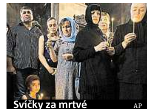
Svíčky za mrtvé

Gruzie včera držela státní smutek za oběti víkendové povodně, která si v Tbilisi vyžádala nejméně dvanáct obětí. Osud dalších dvou desítek lidí zůstává neznámý, pátrají po nich záchranáři, podobně jako po potenciálně nebezpečných zvířatech, která uprchla z městské zoologické zahrady. ČTK