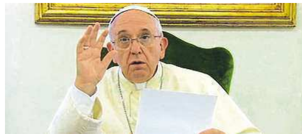
Papež František

lů a knihoven s duchovní literaturou bylo tehdy zničeno a mnoho muslimských a křesťanských duchovních úřady pozatýkaly. Komunistický režim se v Albánii zhroutil v roce 1992. Následující rok tuto balkánskou zemi navštívil tehdejší papež Jan Pavel II. František od svého zvolení uskutečnil cestu do Brazílie a na Blízký východ. ČTK