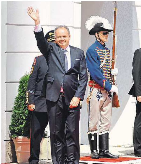
Prezident Andrej Kiska