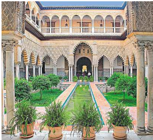
Komplex paláců v mudejarském stylu Alcázar.

Sevilla je kromě gotické a renesanční architektury bohatá především na svěbytný mudejarský styl, v kterém se kombinují prvky evropského a islámského umění, důkazem toho je především komplex paláců Alcázar. Mezi další dominanty města patří katedrála svatě Marie, jež je největší gotickou katedrálou a čtvrtým největším kostelem na světě hned po svatém