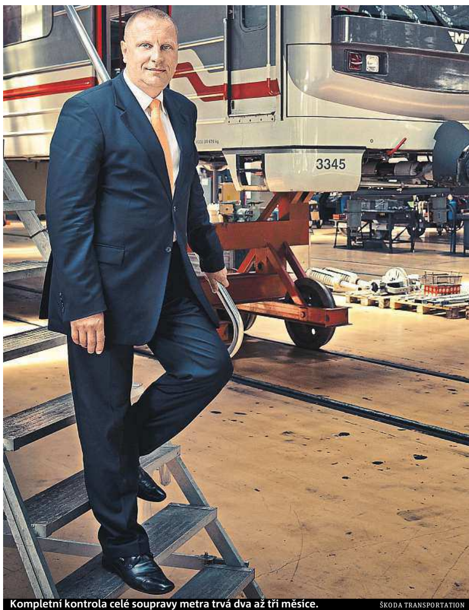
Kompletní kontrola celé soupravy metra trvá dva až tři měsíce.

Souprava po střetu zamíří do depa, kde následují dvě fáze úklidu. Nejdříve přijíždí pohřební služba, která prohlédne vůz a postará se o zbytek ostatků, pak přichází na řadu úklid. Souprava projede myčkou, pak se prohlédne, zkontroluje možné poškození – jestli nedošlo k porušení třeba elektrického vedení. Horší než střet se sebevrahem je střet se živým člověkem, vandalem.