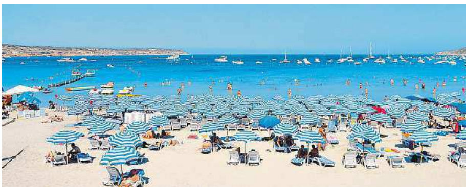
Na maltských plážích panuje pohoda. Dovolenu ale můžete trávit i aktivněji.

„Tisíce turistů z celého světa sem lákají vzrušující pobřežní scenerie,“ říká Juraj