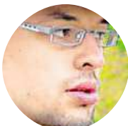
John Donutman Nemyslím si, spíš se tím Češi chlubí, než že by to byla pravda.