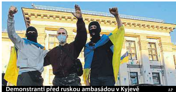
Demonstranti před ruskou ambasádou v Kyjevě

Moskva včera žádala o svolání Rady bezpečnosti OSN potom, co demonstranti v Kyjevě napadli ruskou ambasádu. Dav rozhořčilo sestřelení ukrajinského armádního letadla v Luhansku. Incident, který stál život 49 lidí, v Kyjevě vyvolal hlučný protest. Dav házel na areál ambasády kamení, zápalné lahve a dělobuchy, poškodil několik aut a vyvrátil vstupní dveře. Místo ruské se na stožáru u velvyslanectví objevila ukrajinská vlajka. ČTK