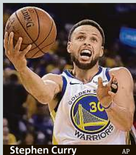
Stephen Curry

Basketbalisté Golden State zahájili finále Západní konference play-off NBA vítězně. V domácí hale si šampioni posledních dvou ročníků poradili v úvodním utkání s Portlandem 116:94. Hvězdný rozehrávač Warriors Stephen Curry přispěl k triumfu 36 body, když trefil devět trojkových pokusů. Těmi si vyrovnal osobní rekord ve vyřazovacích bojích.