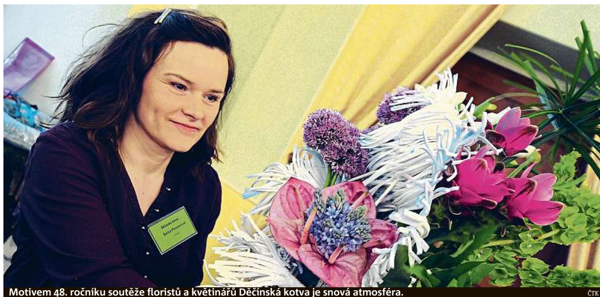
Motivem 48. ročníku soutěže floristů a květinářů Děčínská kotva je snová atmosféra.

Provoz na silnicích. Informace z vozidla míří přes mobilní propojení k prodejčům, automobilkám, případně státu. Úvahy vs. realita. Šedesát procent lidí by si koupilo elektromobil, loni se jich prodalo jen 725 STRANA 4