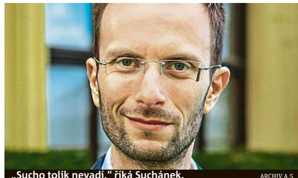
„Sucho tolik nevdá,“ říká Suchánek.

Podle něj dosahují kořeny vinné révy dle stáří vinice