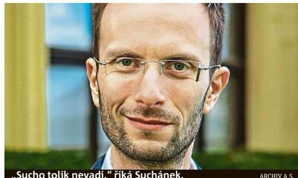
„Sucho tolik nevdá,“ říká Suchánek.

Podle něj dosahují kořeny vinné révy dle stáří vinice