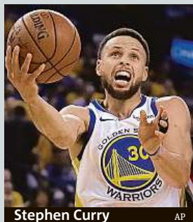
Stephen Curry

Basketbalisté Golden State zahájili finále Západní konference play-off NBA vítězně. V domácí hale si šampioni posledních dvou ročníků poradili v úvodním utkání s Portlandem 116:94. Hvězdný rozehrávač Warriors Stephen Curry přispěl k triumfu 36 body, když trefil devět trojkových pokusů. Těmi si vyrovnal osobní rekord ve vyřazovacích bojích.