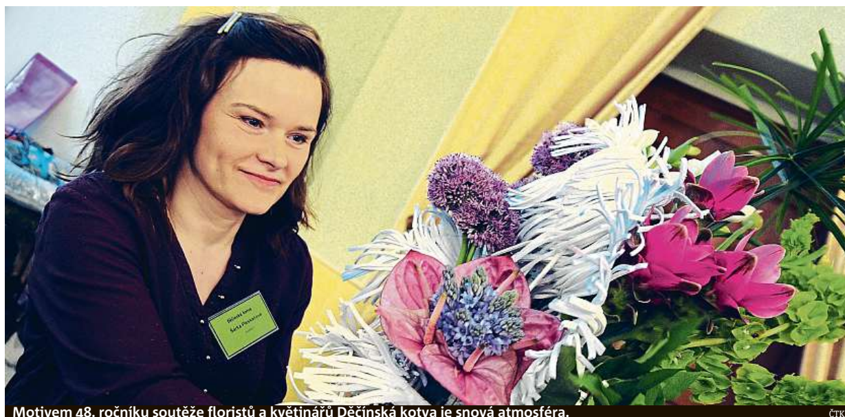
Motivem 48. ročníku soutěže floristů a květinářů Děčínská kotva je snová atmosféra.

Provoz na silnicích. Informace z vozidla míří přes mobilní propojení k prodejčům, automobilkám, případně státu. Úvahy vs. realita. Šedesát procent lidí by si koupilo elektromobil, loni se jich prodalo jen 725 STRANA 4