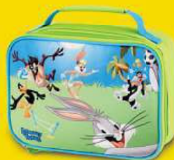
Dvačlenný box Kačer Duffy, Jary Bugs Bunny, Sylvester, Lola Bunny