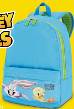
mič Sylvester & Tweety