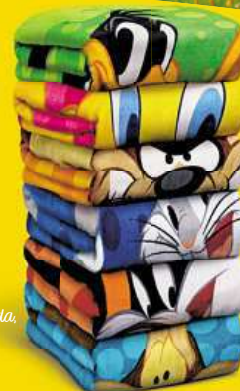
Plážová osuška Kačer Duffy, Kojot Wilda, Jary Bugs Bunny, Tweety, Sylvester

NASBÍREJ CELOU VÝBAVU LOONEY TUNES A UŽIJ SI PARÁDNÍ PRÁZDNINY.