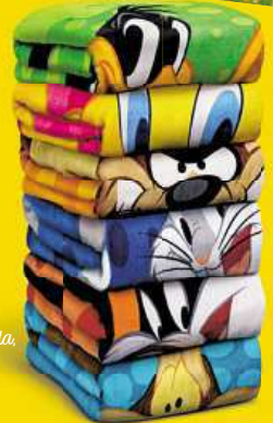
Plážová osuška Kačer Duffy, Kojot Wilda, Jary Bugs Bunny, Tweety, Sylvester

NASBÍREJ CELOU VÝBAVU LOONEY TUNES A UŽIJ SI PARÁDNÍ PRÁZDNINY.