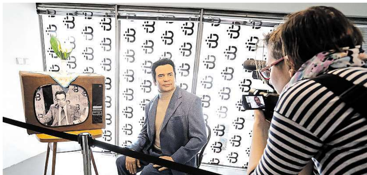
Pan Majer z Arabely a spol. V pražském Tančícím domě začala výstava Retro biják 60.–90. let.

Bez šance. Jen každé desáté dítě pozná skrytou reklamu, když mu ji servírují youtubeři. Slepí fanoušci. Jejich idoly jim vnucují oblečení i hry. Odborníci. Podle nich by pomohlo výraznější upozornění STRANA 3