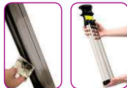
Filtr není třeba nikdy vyměňovat! Stačí ho jen jednoduše vyjmout a oříznout. Účinek filtrace ihned vidíte!

Čtvrtinu Čechů trápí alergie! Naše babičky trávily venku na louce nebo v seníku celé dny a alergickou rýmu neznaly. Za několik posledních let vzrostl počet astmatiků o neuvěřitelných 170 % a alergická rýma trápí už 40 % českých dětí. Čím to je? Na vině je především náš „moderní“ způsob života, díky němuž trávíme příliš mnoho času v umělém a nezdravém prostředí, na které není náš organismus stavěný.