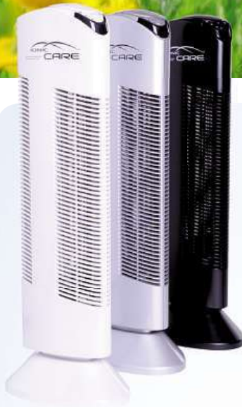
Čističku vzduchu Ionic-CARE Triton X6 můžete zakoupit ve třech barevných provedeních.

Zdravý vzduch z přírody do vašich domovů