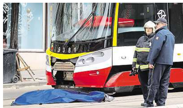
Jeden ze dvou mužů zůstal ležet pod tramvají.

Jedna z nejtragičtějších nehod za poslední roky se stala včera v Praze. Tramvaj srazila v centru Prahy dva chodce. Oba zemřeli. Šlo o dva muže ve věku zhruba 60 let. Záchranáři je asi 45 minut resuscitovali. „Záchranáři u obou mužů zajistili dýchací cesty, napojili na monitor, provedli veškeré život zachraňující úkony. Bohužel se přes veškerou jejich snahu ani jednoho muže zachránit nepodařilo.“