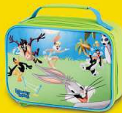
Dvačlenný box Kačer Duffy, Jary Bugs Bunny, Sylvester, Lola Bunny