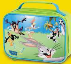
Dvačlenný box Kačer Duffy, Jary Bugs Bunny, Sylvester, Lola Bunny