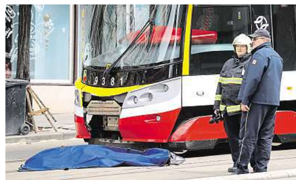
Jeden ze dvou mužů zůstal ležet pod tramvají.

Jedna z nejtragičtějších nehod za poslední roky se stala včera v Praze. Tramvaj srazila v centru Prahy dva chodce. Oba zemřeli. Šlo o dva muže ve věku zhruba 60 let. Záchranáři je asi 45 minut resuscitovali. „Záchranáři u obou mužů zajistili dýchací cesty, napojili na monitor, provedli veškeré život zachraňující úkony. Bohužel se přes veškerou jejich snahu ani jednoho muže zachránit nepodařilo,“