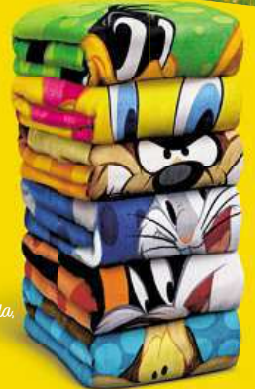
Plážová osuška Kačer Duffy, Kojot Wilda, Jary Bugs Bunny, Tweety, Sylvester

NASBÍREJ CELOU VÝBAVU LOONEY TUNES A UŽIJ SI PARÁDNÍ PRÁZDNINY.