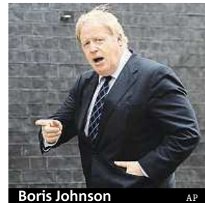
Boris Johnson

Podle bývalého londýnského starosty Borise Johnsona se Evropská unie snaží vytvořit evropský superstát. „Napoleon, Hitler, zkoušeli to různí lidé a vždy to skončilo tragicky. Evropská unie se snaží dělat totéž, i když odlišnými metodami,“ řekl. Podle Johnsona, který patří k hlasitým zastáncům odchodu Británie z Evropské unie, postrádá osmdesátiletá demokracii a sjednocující autoritu a je odsouzena k neúspěchu. Důsledek je podle bývalého starosty v nedostatku demokracie v Evropě. Johnsonovy výroky kritizovala labouristická opozice. ČTK