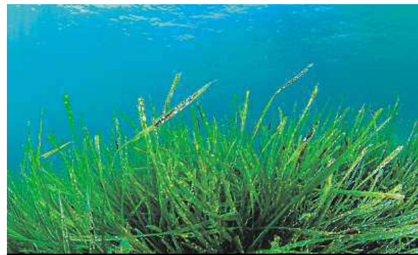
Sinice spirulina by mohla řešit podvýživu. WHATISSPIRULINA.ORG

Spirulina volně roste v mírně slaných jezerech v tropických zemích. Je tedy snadné vytvořit pro ni přirozené prostředí v nádrži, protože jí stačí teplo a světlo. Největšími producenty spiruliny jsou Čína a Kalifornie. Sinice se