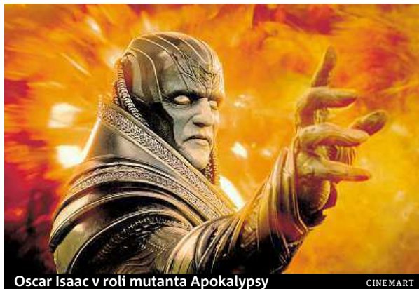
Oscar Isaac v roli mutantu Apokalypsy

Apokalypsa byl od počátku civilizace uctíván jako bůh. Když se po několika tisících let v roce 1983 probudí, zjistí, že svět je úplně jiný. Sestaví tak tým mutantů včetně zklamaného Magneta s cílem očistit lidstvo a nastolit nový světový řád, kterému chce vládnout. Proto Raven s pomocí profesora X stane v čele týmu X-Menů, aby zastavili silného nepřítele a zachránili lidstvo před zánikem.