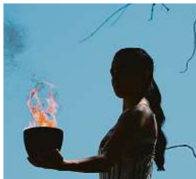
Včerejší generální zkouška v řecké Olympii

„Je to pro mě velká čest. Doufám, že nezklamu důvěru, kterou jste mi dali,“ svěřila se herečka, která si odbyla generálku této slavnostní chvíle včera dopoledne. Všechny kněžky měly už při ní nové kostýmy – černo-bílé šaty, což je změna oproti dosavadním jednobarevným bí-