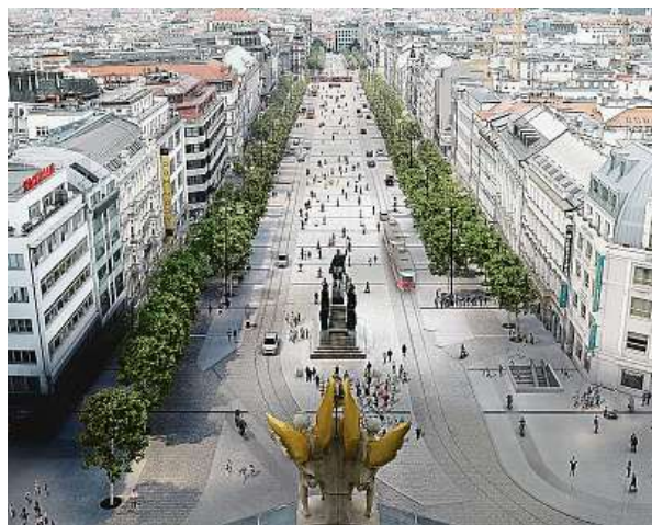
Stavba trati má probíhat současně s rekonstrukcí horní části náměstí, jako se to dělo u jeho spodní části.

Výstavba začne zmíněnou tříměsíční výlukou ve Vodičkově a Jindřišské ulici, kdy dopravní podnik zrekonstruuje nejprve trať ve Vodičkově mezi náměstím a Palackého ulicí. Zároveň dělníci opraví stropní desku stanice metra A Můstek, která se nachází pod kolejemi. Poté vybudují výhybky a odbočku za zbytek