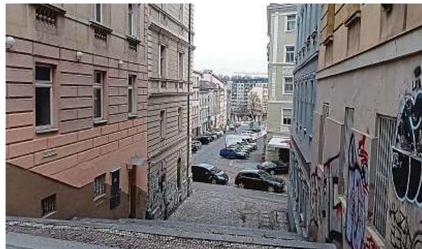
Horní záběr už narušují jednak zaparkovaná auta, jednak paneláky v pozadí. S graffiti si štáby obvykle snadno poradí.

Francie či jiná země. Stačí šikovně postavit reklamní tubus s plakáty nebo malou budku-trafikku.