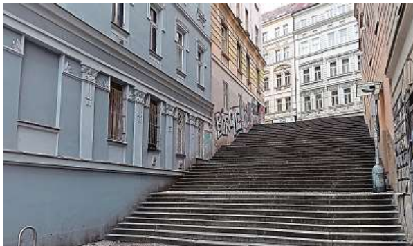
Nejčastěji naši nebo zahraniční filmaři využívají široké schody mezi ulicemi Táboritskou a Chelčického ze spodního pohledu.

Vzpomeňte si například na film Protektor, kde se záběry z ulic často odehrávají jen v detailech, hlavní hrdina jede na bicyklu a kamera ho snímá zblízka hodně odspodu, aby byla vidět maximálně přízemní okna. Najít v Praze místa na dobovky, to je zapeklitá záležitost. Pokrok a údržbu nezastavíš. Oprýska-