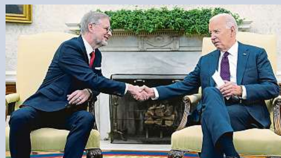
Petr Fiala s Joem Bidenem v Oválné pracovně Bílého domu