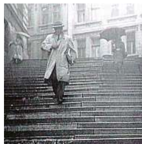
Černobílý film Tři přání z roku 1958

Oblíbenou filmařskou formou je posadit na schodiště žebráka s kloboukem nebo flašinetem, žebrající hudebníky s houslemi či harmoni-