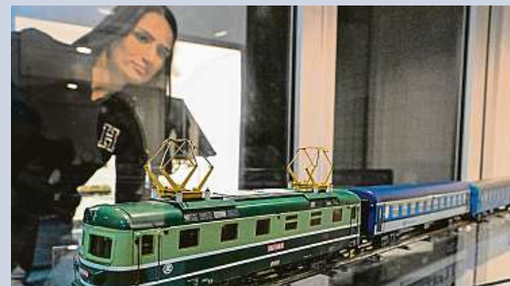
Výstava modelové železnice a železničních modelů