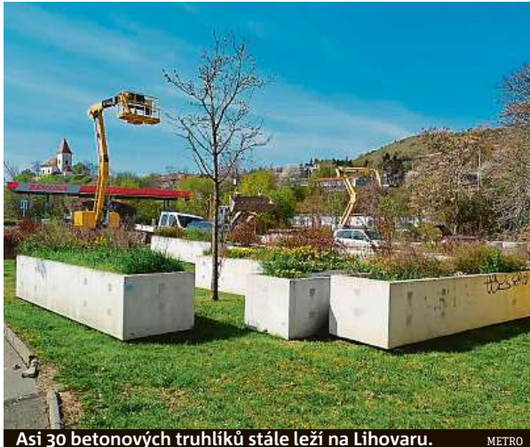
Asi 30 betonových truhlíků stále leží na Líhvaru. METRO

Přece jen se cesta našla a většina truhlíků už má nový domov. „Mimo společ-