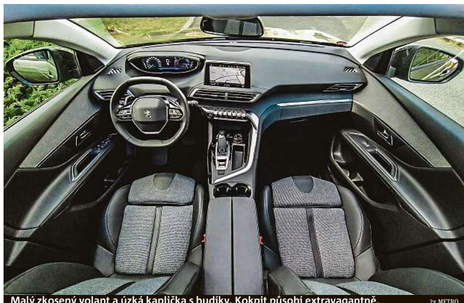
Malý zkosený volant a úzká kaplička s budíky. Kokpit působí extravagantně.

A uvnitř? No je to přece Francouz, buďte rádi! HOP