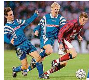
Slavia proti Bordeaux

Největší fotbalové zápasy historie nebo úspěchy českých reprezentantů. To je náplň sportovních médií.